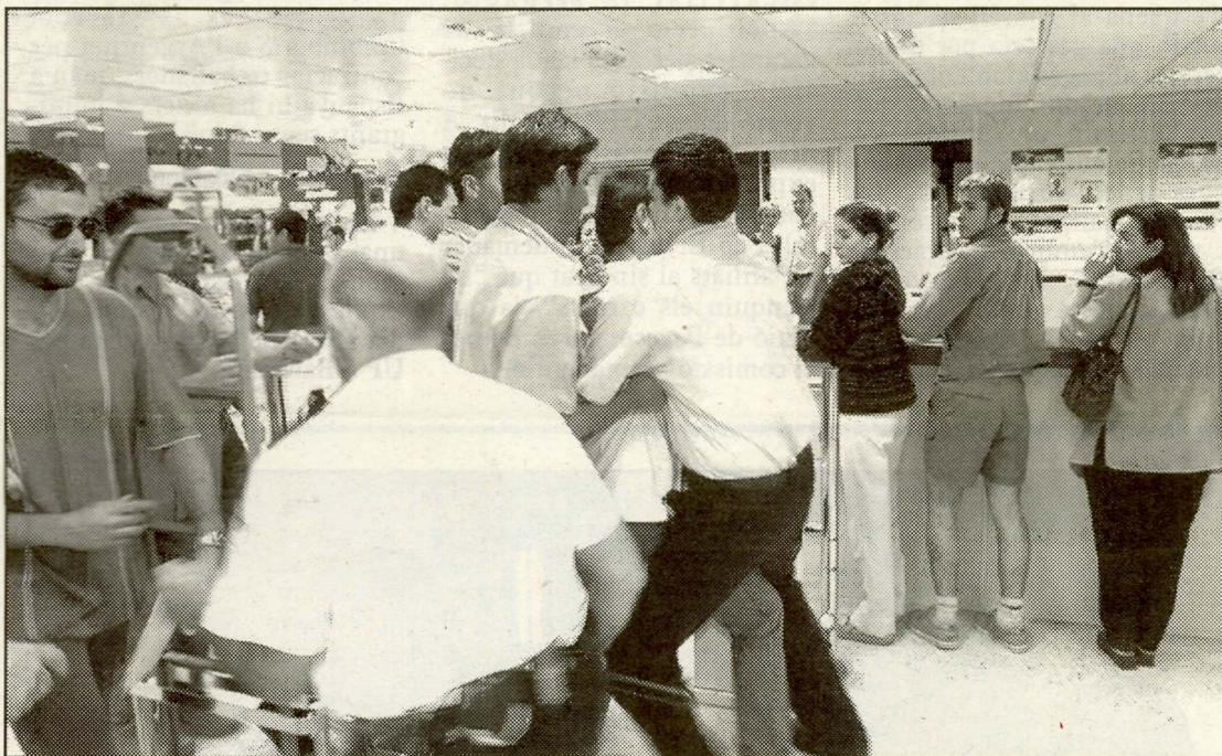
Agricultors i personal de seguretat van protagonitzar una picabaralla a l'entrada del centre.