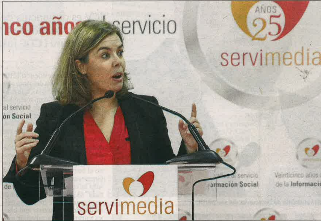
La vicepresidenta del Govern central, Soraya Sáenz de Santamaría.

D'altra banda, el president del Govern central, Mariano Rajoy, va assegurar ahir, abans de la compareixença de Mas davant dels mitjans, que la decisió de no convocar el 9-N tal com s'havia previst era una "excel·lent notícia". En aquest sentit, va tornar a "allargar la mà" al diàleg,