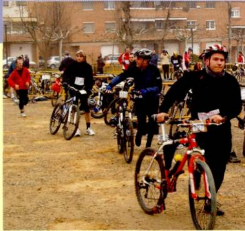
17 i 18 de gener de 2009, festa de l'Esport.