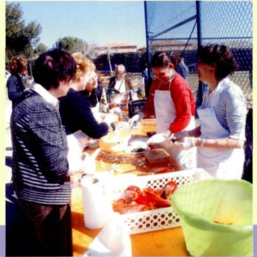
8 de març de 2009, festa de la matança del porc, al Parc del Graó.