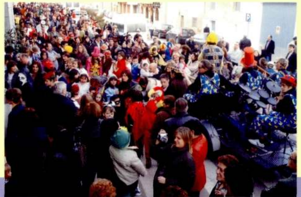
Del 20 al 25 de febrer de 2009, actes de Carnaval.