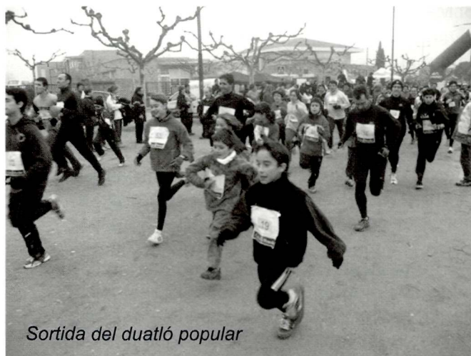
Sortida del duatló popular