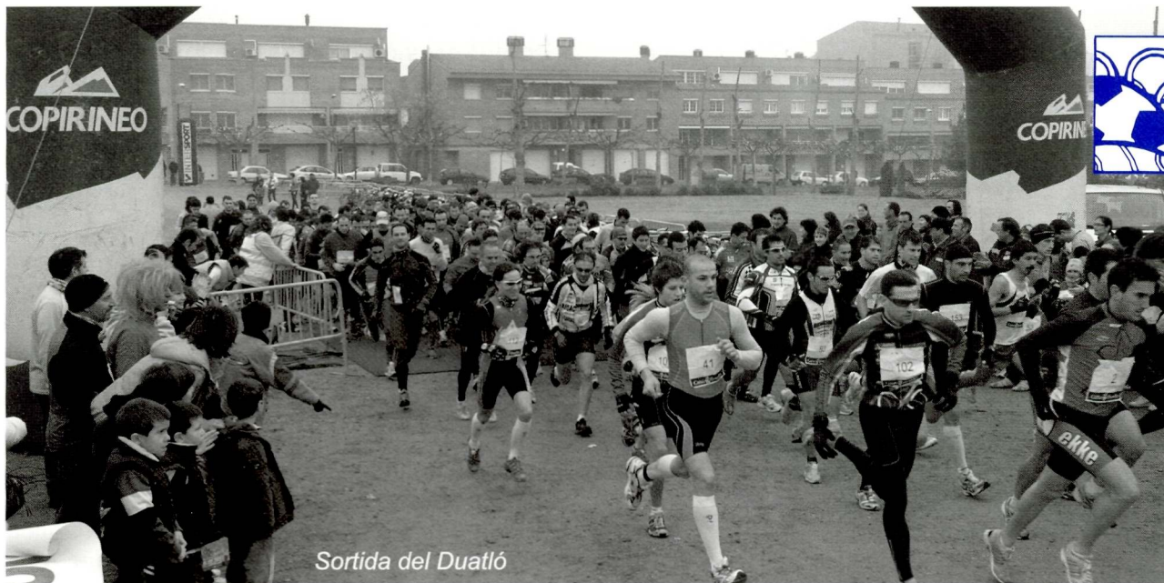
Sortida del Duatló

Es van traçar dos proves. Per una banda, la duatló popular només per a veïns d'Alpicat, amb un recorregut de 3 quilòmetres atlètics pel nucli d'Alpicat i 6,5 quilòmetres en BTT pels camins de l'horta. Un total de 100 corredors van participar, la majoria no hi participaven per aconseguir un bon temps i s'hi va implicar tota la família, perquè el més important és fer esport, jugar i divertir-se! Cal assenyalar que aquesta prova era solidària, ja que un euro de cada inscripció es va recaptar per a l'ONG Alpicat Solidari.