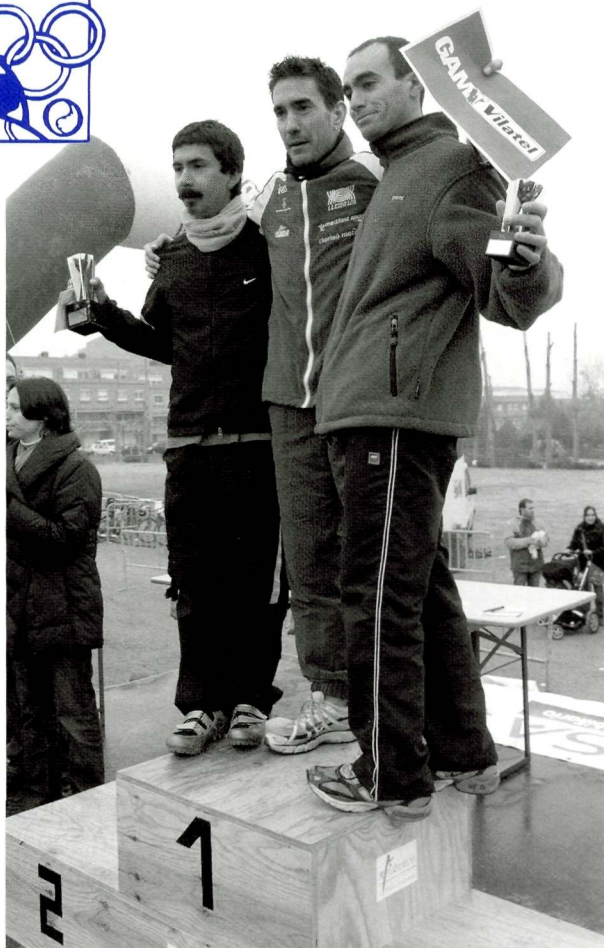
Guanyadors categoria masculina

En categoria femenina les guanyadores del duatló van ser: