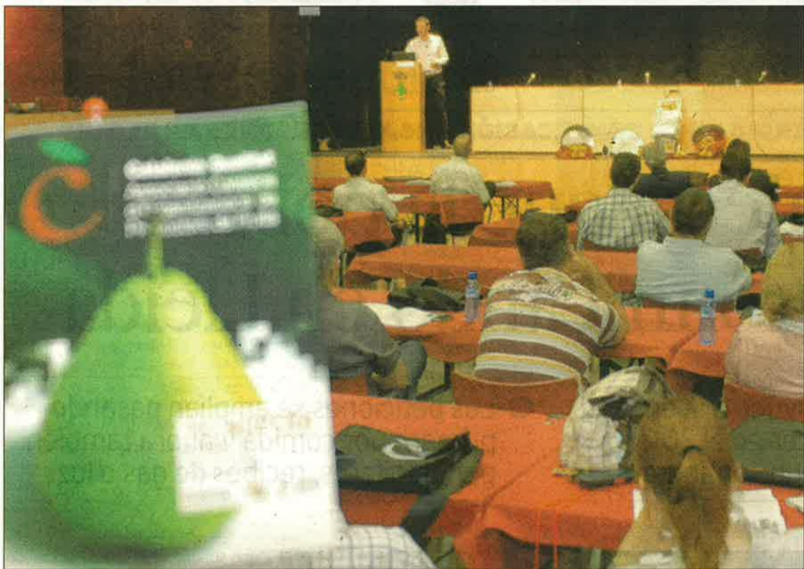
Alpicat acull novament una altra edició del Congrés Nacional de la Pera, on s'intercanvia informació al voltant de les novetats aplicables al cultiu