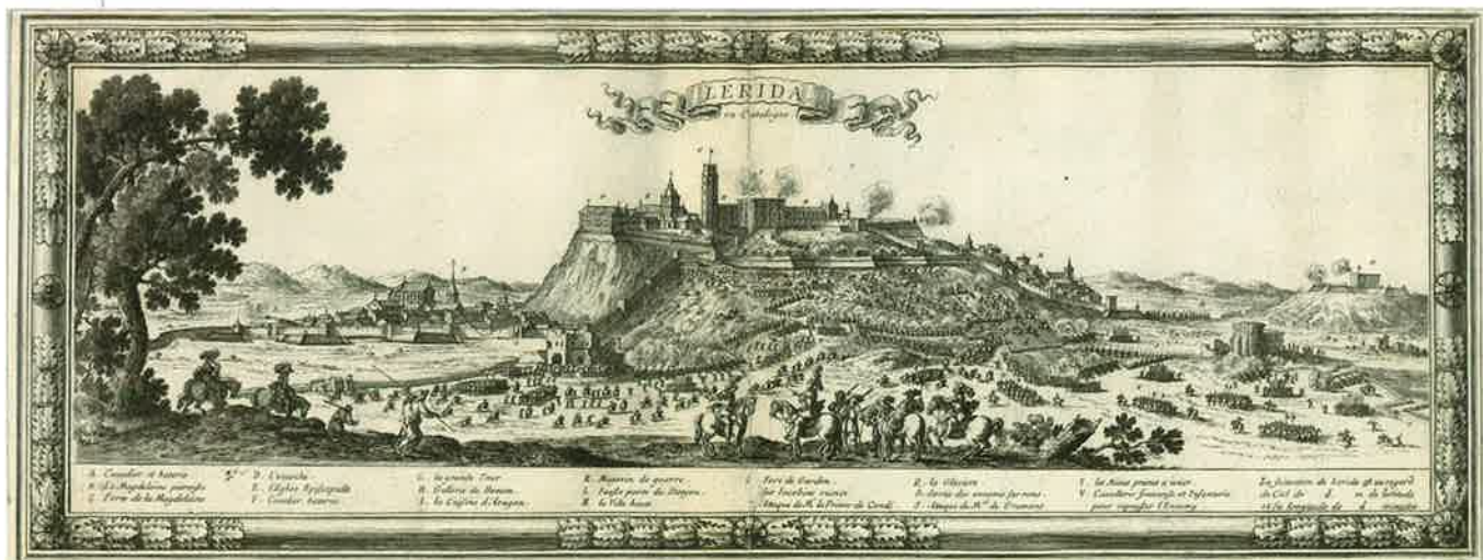
Il·lustració del setge de Lleida de 1707 des d'una perspectiva de l'exèrcit borbònic.