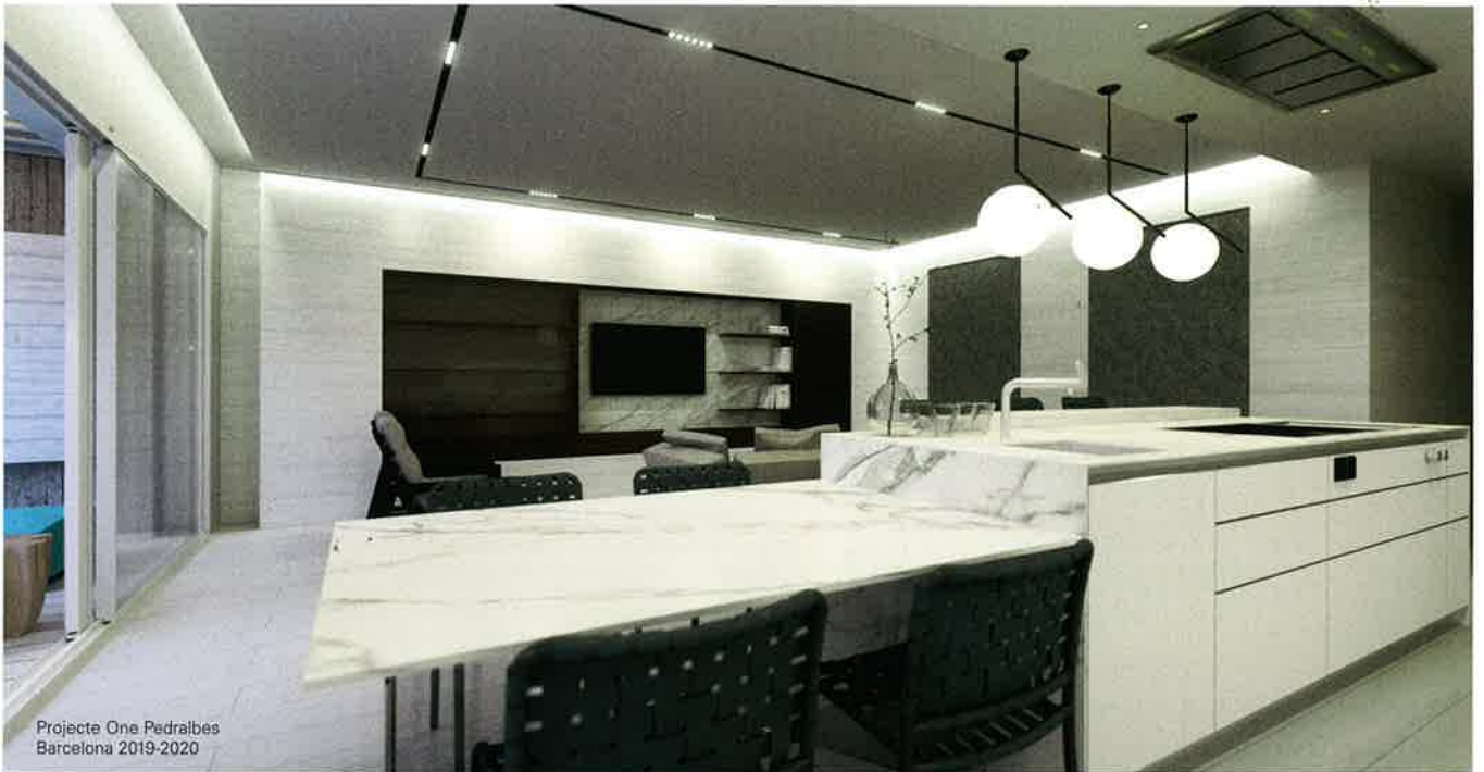
Projecte One Pedralbes Barcelona 2019-2020

De forma clara, el succés més sonat i que ha suscitat més debat en la historiografia lleidatana té com a eix central la matança del Roser, espai on van ser assassinades, segons alguns cronistes de l'època, més de 700 persones de forma indiscriminada i brutal. Tanmateix, la mort de població va més enllà i, segons