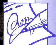
Eines que s'utilitzaven quan vaig marxar d'Alpicat