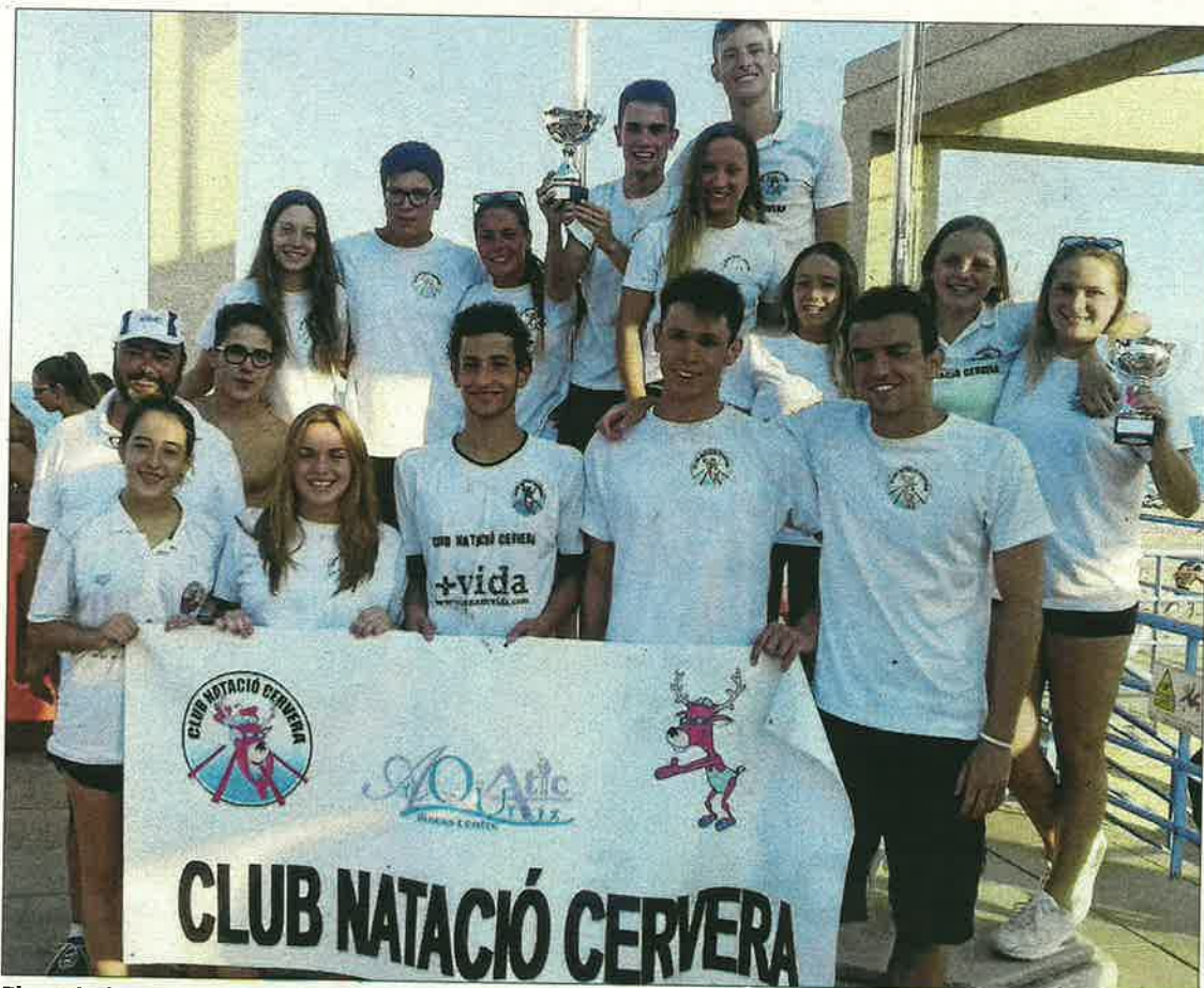
Els nadadors del CN Cervera celebren la primera posició en el rànquing de clubs del campionat.