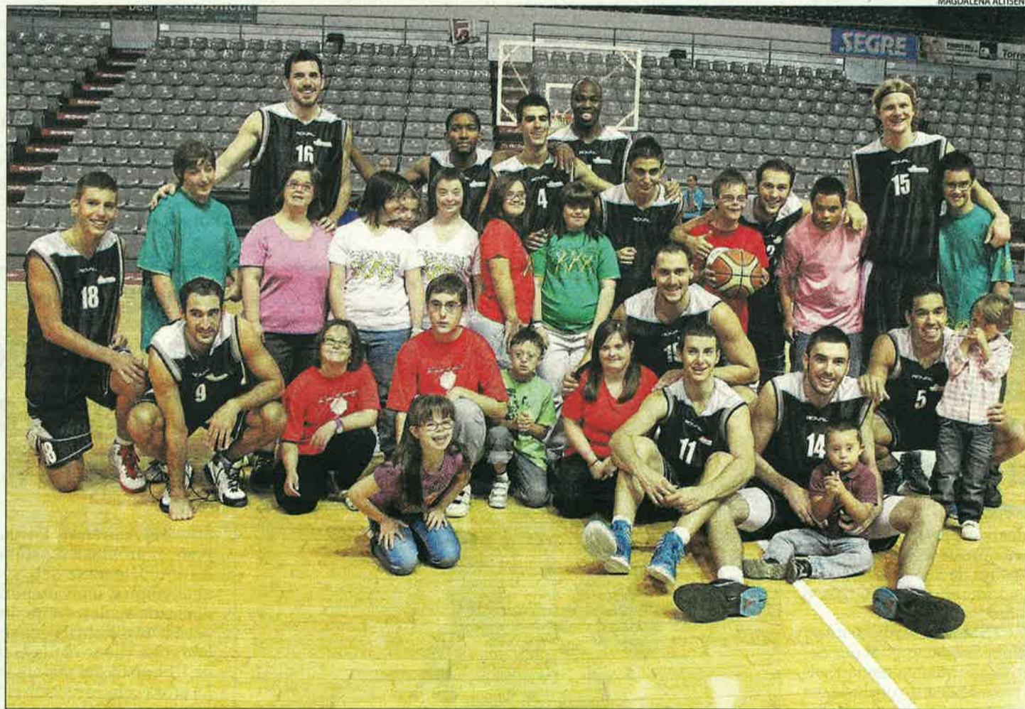
Els jugadors de la primera plantilla es van fotografiar ahir amb els integrants de Down Lleida per a un calendari solidari.