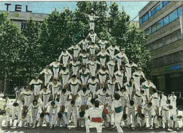
FIGURES HUMANES. L'escala, la pira, la piràmide drets, el castell amb agulla, els pilars de 3 o els ventalls són algunes de les figures que bastiran els Falcons de Vilafranca diumenge a la tarda.

Grups en viu i sessions recolliran el relleu d'Er Taqueta i el DJ, que actuaran demà a la nit. Cediran el testimoni l'endemà als El Último Ke Zierre, respondent a la petició dels penyistes. Mentrestant, els més madurets es podran deixar endur pels compassos de l'orquestra Rosaleda, que actuarà també a la tarda. Maravella, el dissabte, i Anònima, diumenge, completaran el tercet orquestral.