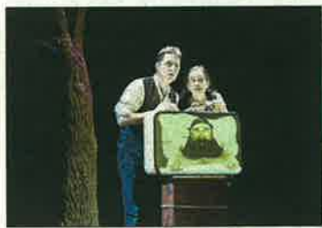
Zum Zum actuen diumenge.