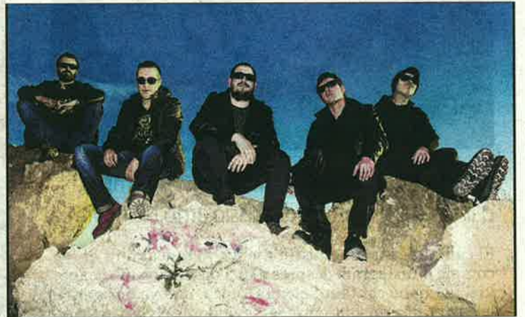
El Último ke Zierre (imatge), La Cintura de Paula o Koers, bloc jove.

15.30-18.30 Megatobogan urbà de 75 metres de llargada. Al carrer del Bosc.