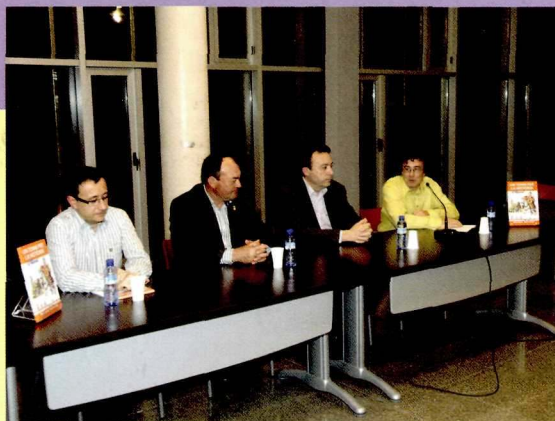
19 de març, inauguració de la quarta i darrera fase de La Unió, corresponent a l'escola de música i dansa, a càrrec de la M. H. Sra. Núria de Gispert i Català, presidenta del Parlament de Catalunya.