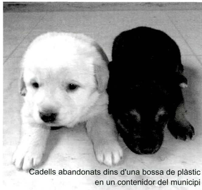
Cadells abandonats dins d'una bossa de plàstic en un contenidor del municipi

Problemes familiars, de trasllat i vacances. Si es vol adquirir un animal, sempre s'ha de tenir en compte el lloc on es viu i si hi ha previstos trasllats de casa o canvis de feina en els següents anys. La mitjana de vida d'un gos o gat és de 15 anys, per tant si se sap que la situació pot canviar en els pròxims anys, és millor adoptar un animal d'una edat avançada (que se li farà un favor) i evitar el trauma que li suposa a l'animal la seva donació o