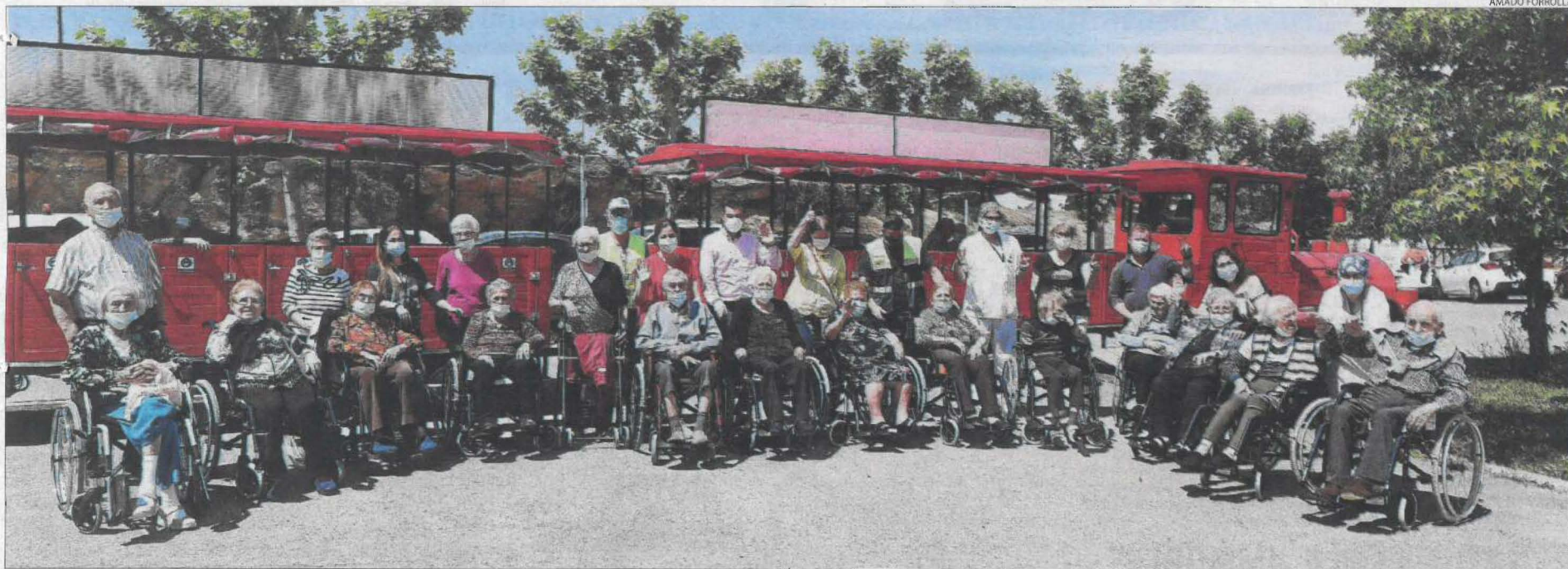
Foto de família dels impulsors de la iniciativa i alguns dels usuaris de la residència ICAD que ahir van pujar al tren turístic.