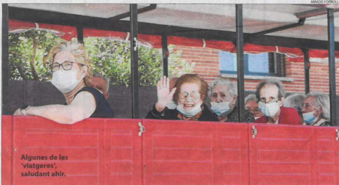
Algunes de les 'viatgeres', saludant ahir.

Muntats al tren respectant els grups bombolla de convivència, els grans van recórrer els carrers de Torre-serona, on alguns dels veïns els van rebre amb entusiasme. Fent aturada a la plaça de l'Ajuntament i a la urbanització del municipi, l'excursió de mitja hora de durada també va incloure una explotació agrícola de pomeres, on els ancians van poder disfrutar de l'entorn rural.