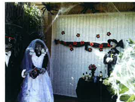
Façana guanyadora del concurs del 2014

Més informació dels actes i bases del concurs a: www.alpicat.cat/joventut .