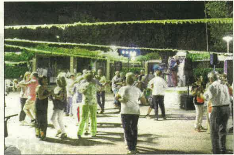
Bellpuig. Festa, dissabte, del Barri del Parc, amb més de 200 persones.