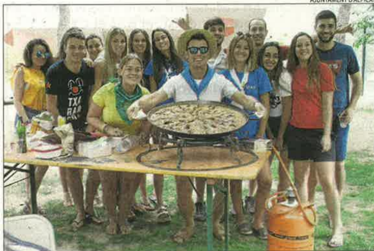
Alpicat. Desenes de participants a les paelles de germanor.