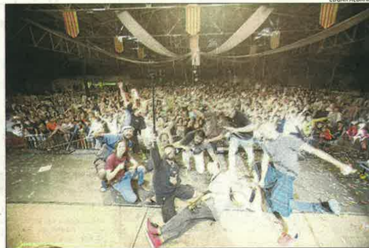
Juneda. La Pegatina va omplir dissabte la pista del Parc Alegria.

voltants de Bellpuig a la Festa del Barri del Parc, on van assistir més de 200 persones, amb sopar popular i ball amb Altarriba Music. Miralcamp, Algerri, Sidamon, Fontllonga o Benavent de Segrià van ser altres de les localitats lleidatanes que van acomiadar l'últim cap de setmana d'agost en festes.