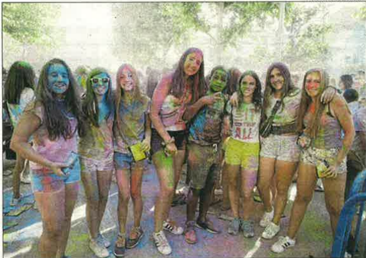
Balàfia. Acolorida festa holi ahir al barri lleidatà.