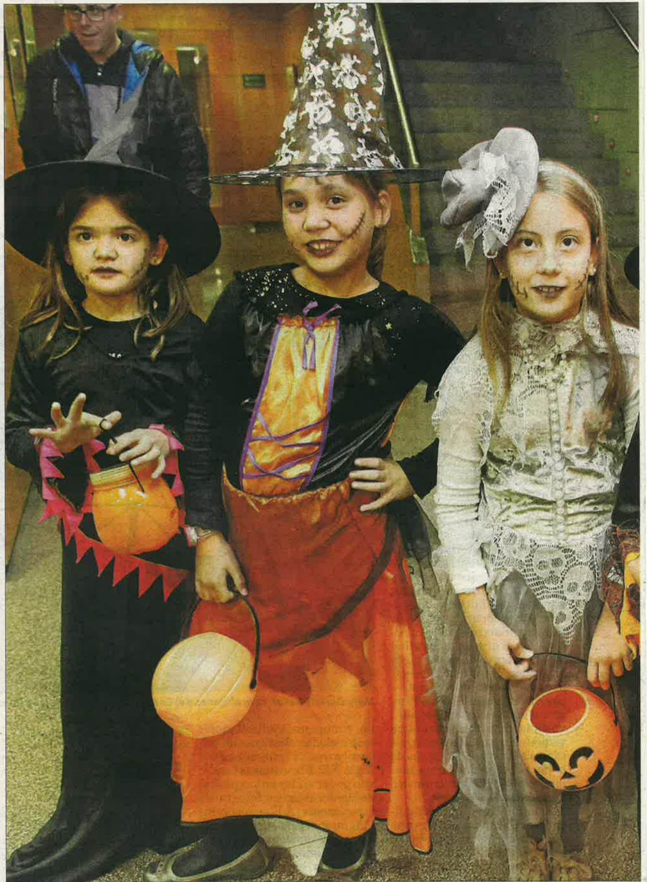
Alpicat va celebrar dimarts una nit de por amb la seua festa de Jalogüing, en la qual no va faltar un passatge del terror.