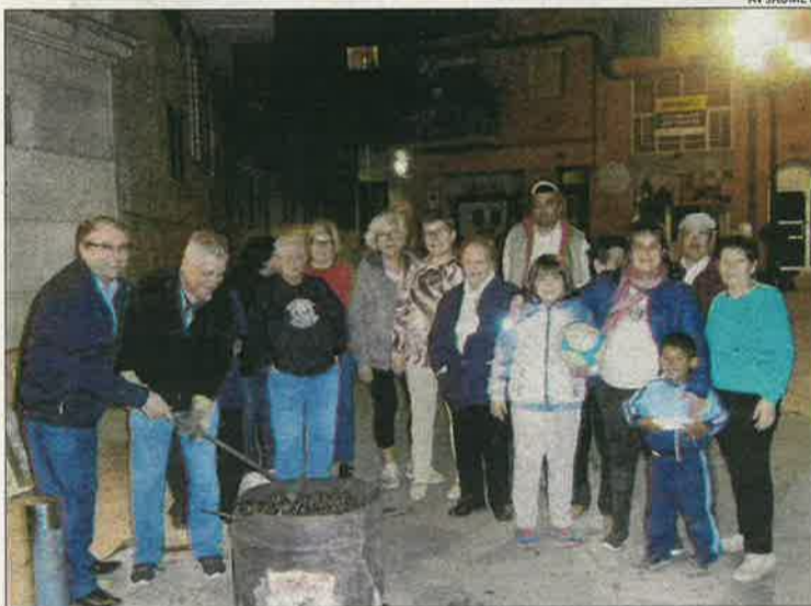
AV JAUME I