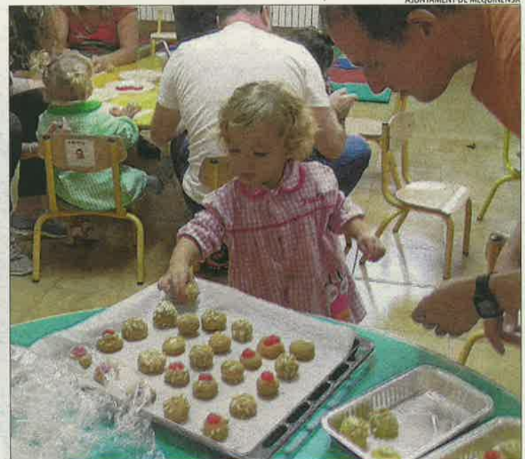
AJUNTAMENT DE MEQUINENSA