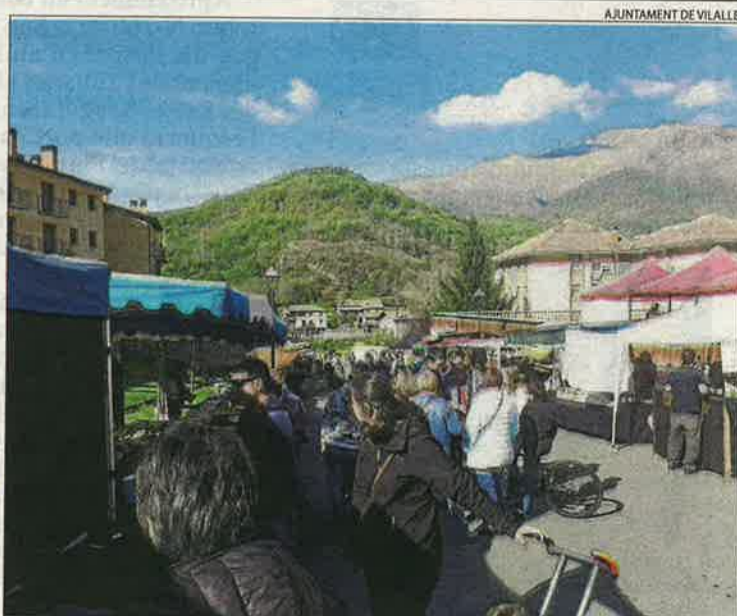
AJUNTAMENT DE VILALLER