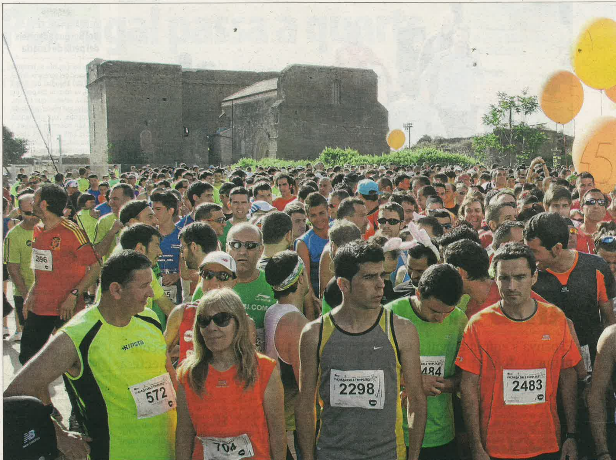
Els participants esperen el moment de la sortida de la sisena edició de la Cursa dels Templers, que va reunir ahir 1.700 atletes, xifra que suposa un nou rècord de participació per a aquesta espec