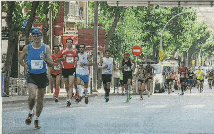
El recorregut de la prova discorre per algunes de les avingudes més amples.

L'Ekke va ser el club amb més participants a la prova, 160, i va aconseguir dos podis, un en cada categoria