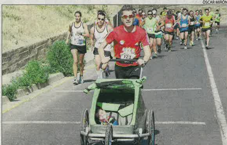
Alguns atletes participen amb els seus fills petits en la prova.