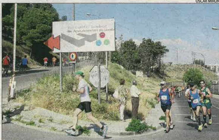
La pujada final suposa un exigent esforç per als corredors.