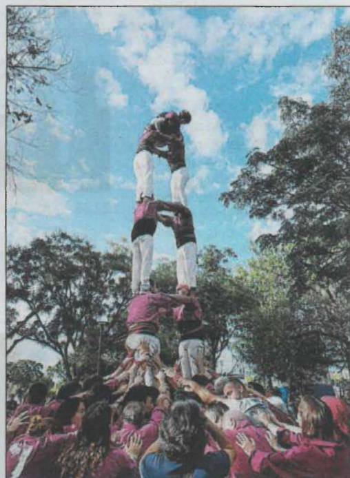
Cinc imatges dels diferents castells que la colla lleidatana va construir en la seva actuació a la Festa Major d'Alpícat