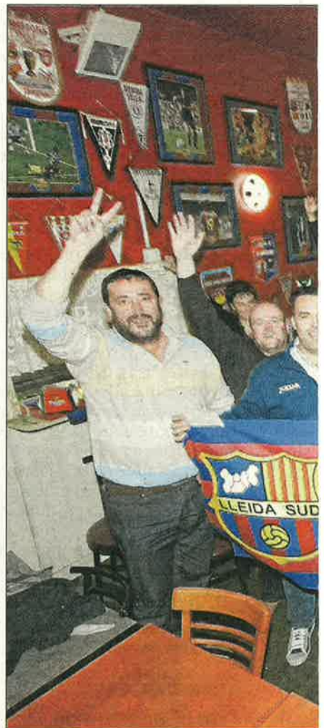
Els representants de les penyes del Barça