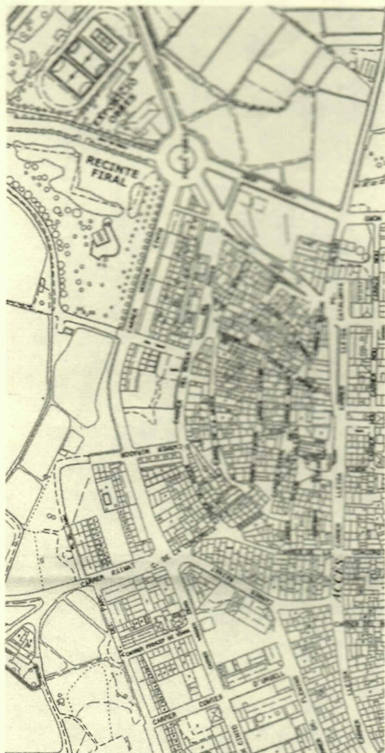
NUCLI URBÀ D'ALPICAT