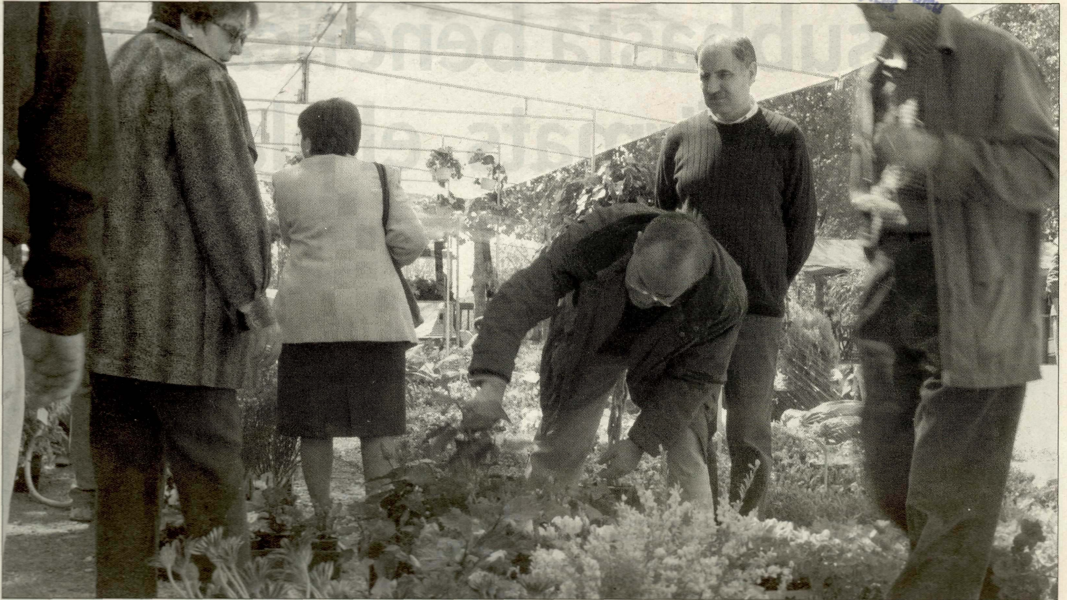
La població d'Alpicat s'omple aquests dies de visitants en la seva fira ecològica