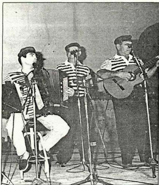
El grup Terraferma realitzarà una cantada d'havaneres. L.M.

Per exemple, enguany, arriba a Alpicat per primera vegada la cursa de llits, molt en voga en altres llocs però que encara no s'havia fet mai en aquesta localitat. Uns altres esdeveniments d'aquest estil són una costellada a les cinc de la matinada, una gimcana automobilística o bé la guerra d'aigua, actes més viats pensats per tal que el jovent d'Alpicat tingui unes activitats més mogudes. Ja se sap: "gent jove, pa toul!"