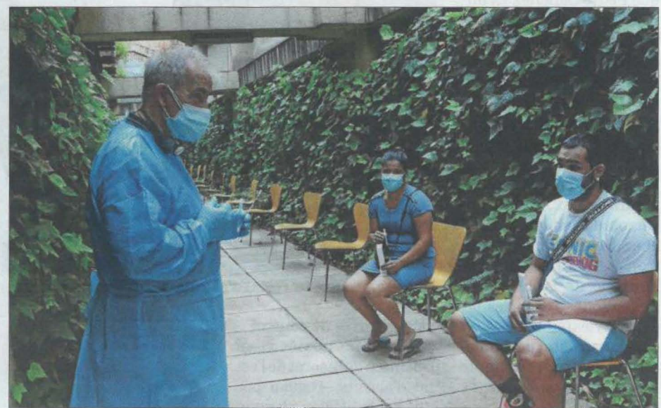
Monitors, durant els tests d'antígens que es van fer la setmana passada

La mesura se suma a les proves a monitors iniciades la setmana passada ■ El resultat s'enviarà a la Meva Salut