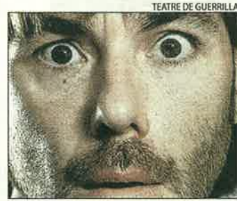
El 'Temps', segons Masferrer.

20.00 Sessió de ball amenitzada per l'orquestra Selvatana.