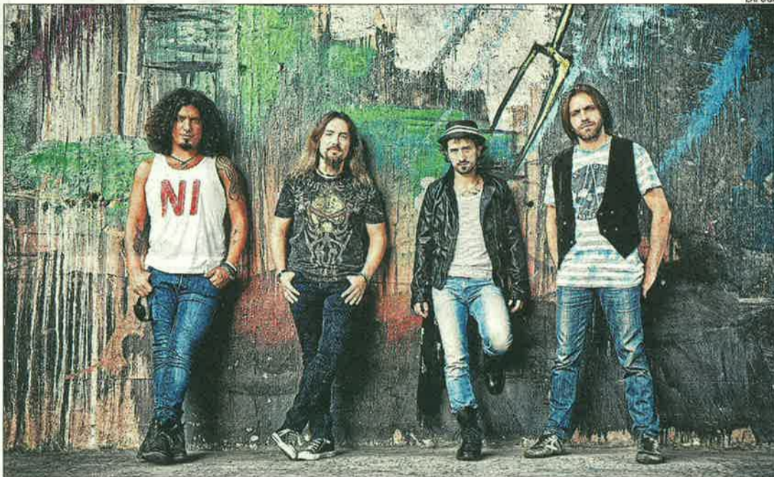
La Fuga compartirà amb The Chronickles l'escenari de les penyes.

D'innovacions, n'hi ha un grapat, però. Incitant a jugar, destaquen la gimcana o la pasterada, muntada pels penyistes veterans. Nous de trinca són també el tastabars o el concurs de coques a la cassola. I mo-