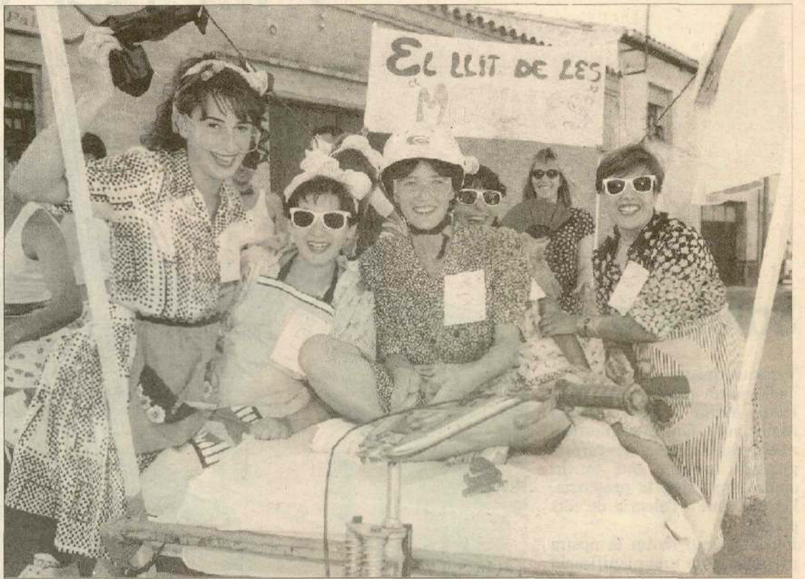
L'any passat s'inicià la tradició de la Cursa de Llits a Alpicat.