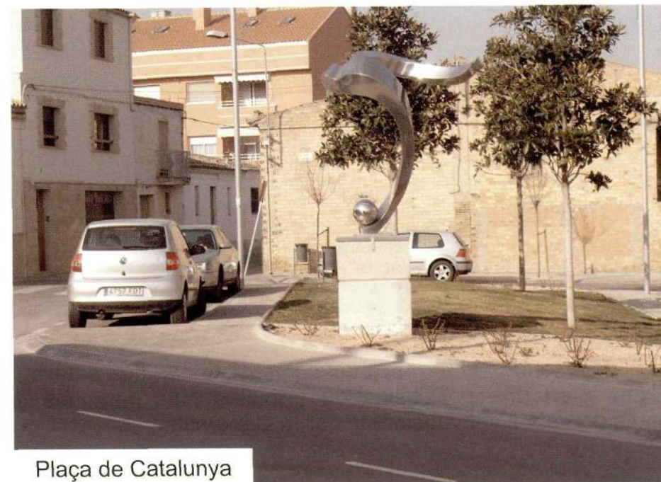
Plaça de Catalunya