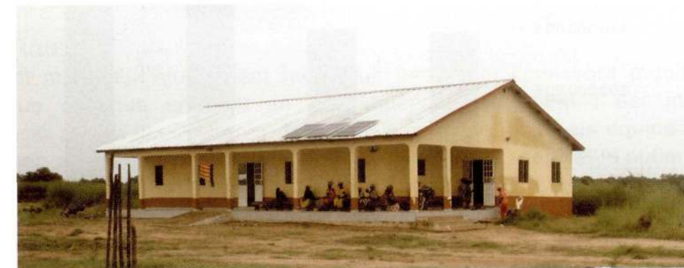
Escola i hospital de Baja Kunda