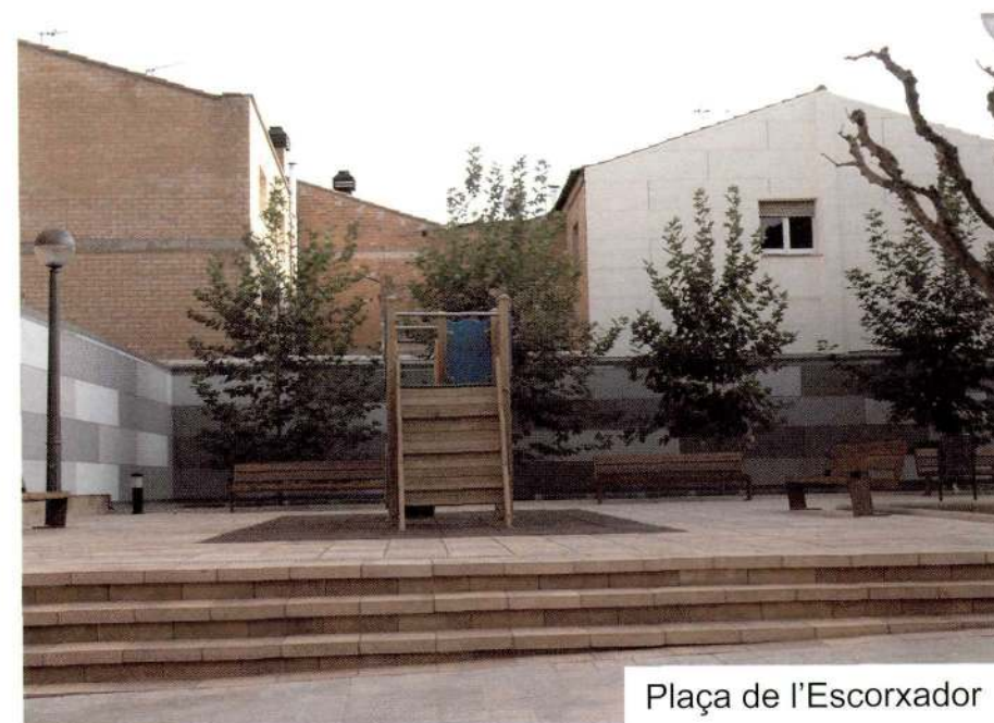
Plaça de l'Escorxador

Amb l'objectiu de millorar-ne el paviment i aconseguir una plaça més funcional, s'ha remodelat la plaça dels Països Catalans, i s'ha convertit en un espai d'esbarjo mitjançant diversos elements de mobiliari urbà i jocs infantils. El cost de reurbanització d'aquesta plaça va ser de 165.783,37 euros, finançats amb diners del Fons Estatal d'Inversió Local.