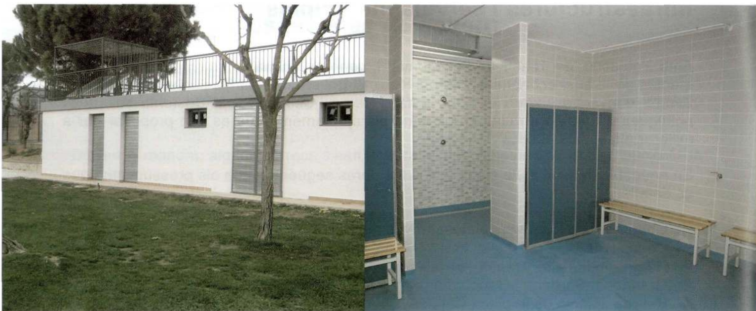
Condicionament dels vestidors