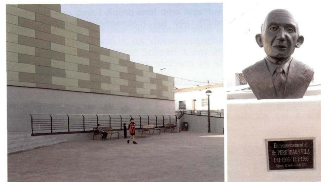
Plaça del carrer Major i bust d'homenatge al Sr. Ibars