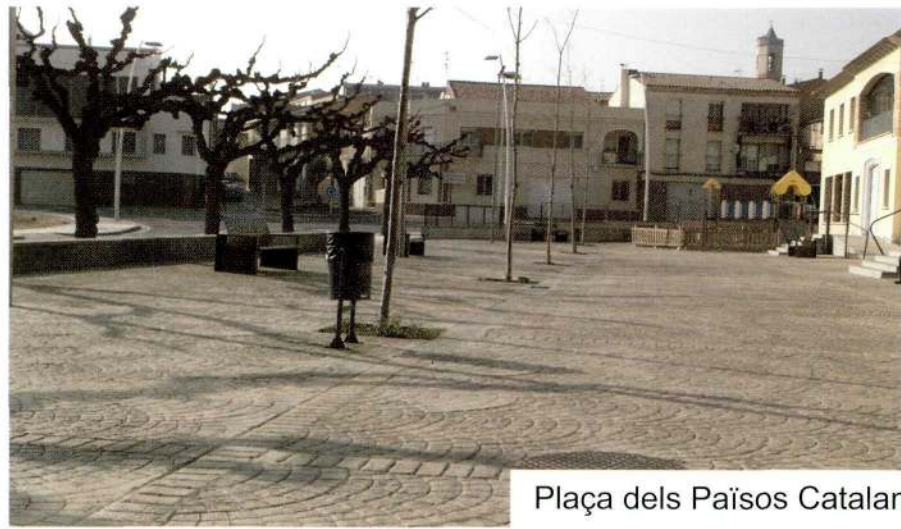
Plaça dels Països Catalans