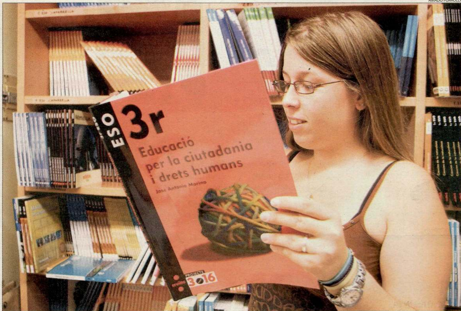
Una jove, fullejant un llibre de text d'educació per la ciutadania de tercer d'ESO.

L'assignatura serà impartida durant una hora a la setmana, no disposa de professorat espe-