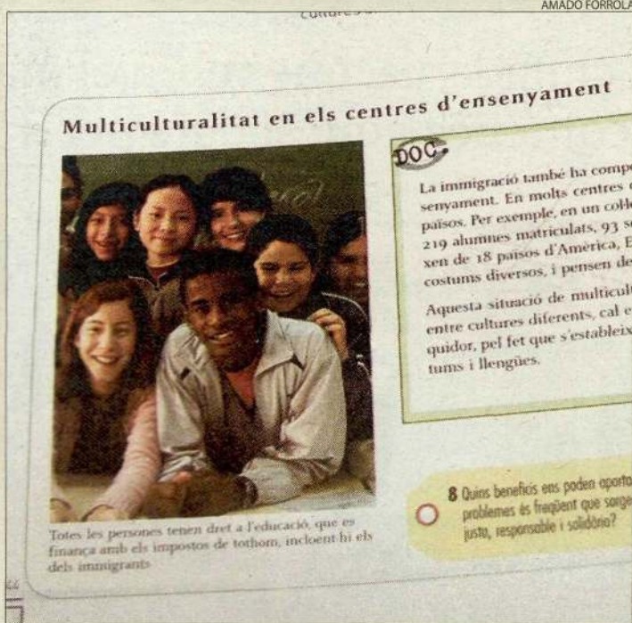
Una pàgina d'un dels llibres, que tracta sobre la multiculturalitat.

■ Per fer pensar els alumnes, proposa organitzar un debat a classe sobre el botellón, amb moderador i tot, o simular-ne un altre en què un alcalde ha de decidir entre respectar la tradició dels toros o el dret dels animals.