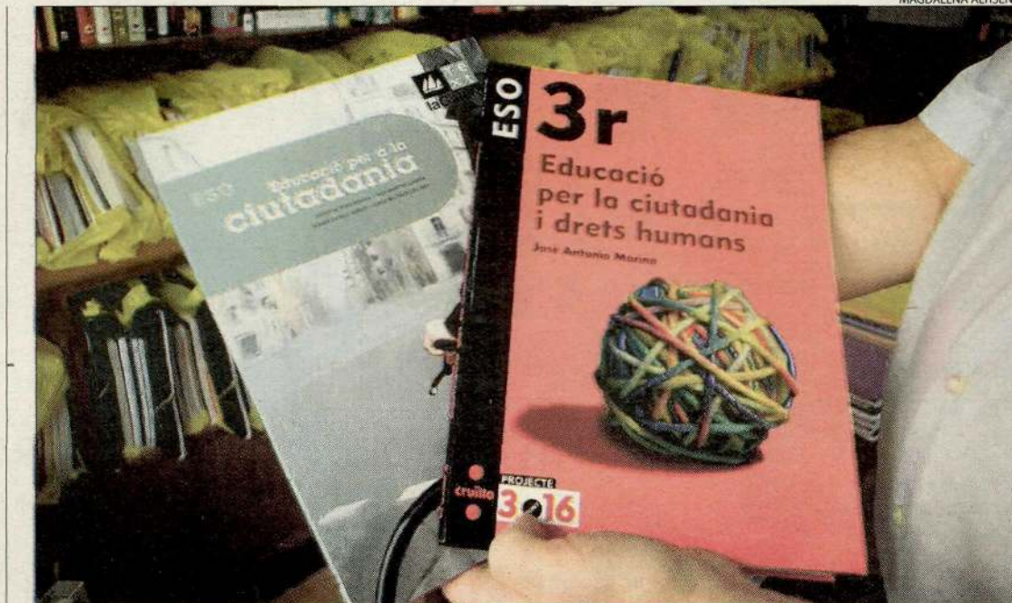
Dos dels llibres de text de la nova assignatura que han publicat les editorials.

La nova assignatura prevista en la llei orgànica d'educació (LOE) naix amb polèmica