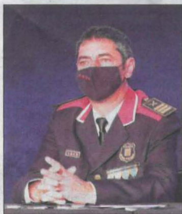
Trapero es va especialitzar en investigació

Procedent d'una família d'immigrants de Valladolid, Josep Lluís Trapero va néixer a Badalona el 1965, i es va criar al barri del Singuerlín de Santa Coloma de Gramenet. Trapero va ingressar l'any 1989 a l'Escola de Policia de Catalunya i va començar a fer d'agent el 1990. Va ser agent de l'àrea bàsica policial de Girona i també de Vielha. També va ocupar el càrrec de caporal d'escamot a la presó de Quatre Camins, a la Roca del Vallès. Més tard, a Blanes i Figueres, s'ocupà del grup d'investigació, àmbit en el qual es va especialitzar. Va estar en aquesta àrea a la regió de Girona, a la Metropolitana Nord, a la Comissaria General Territorial de Bar-