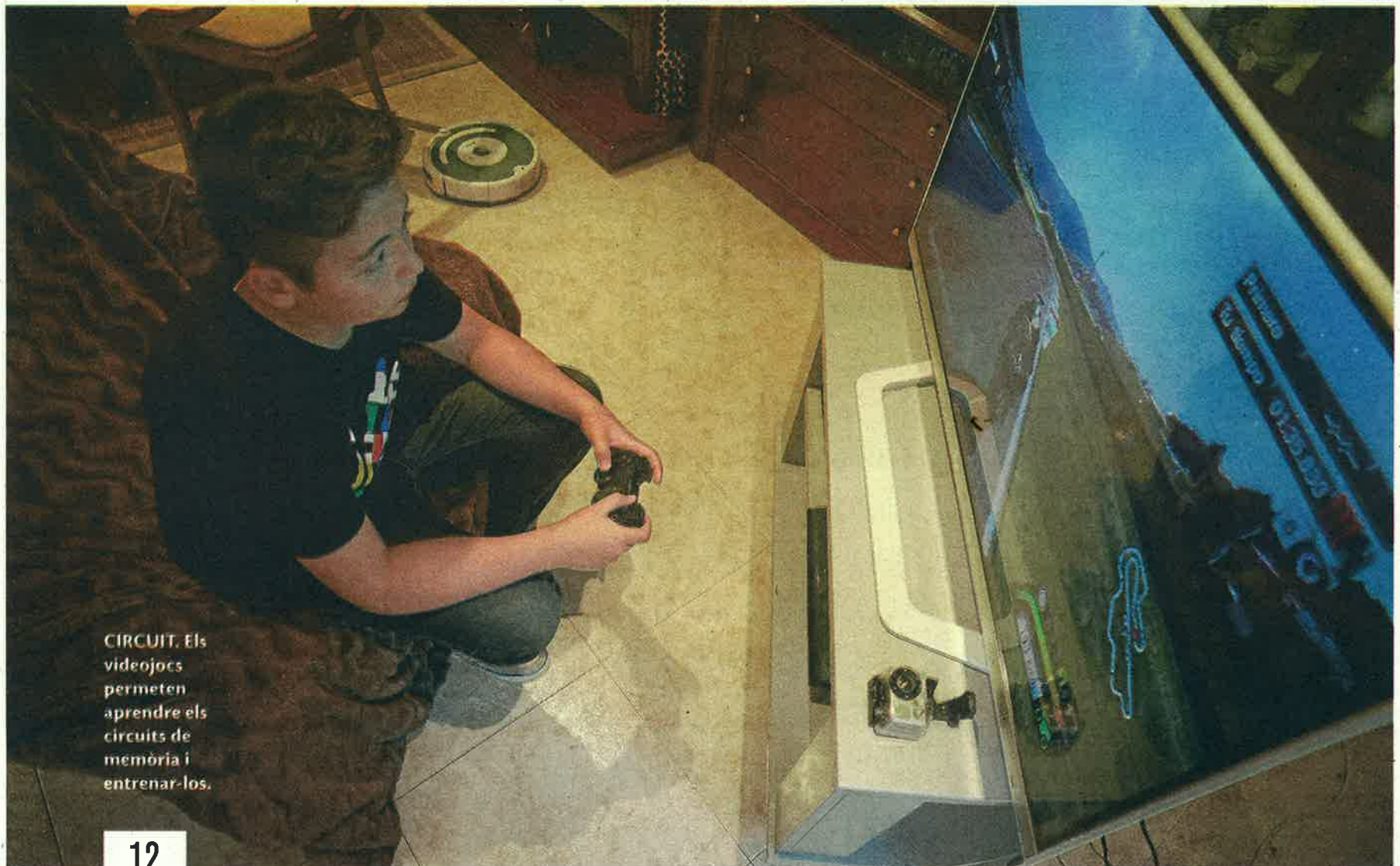
CIRCUIT. Els videojocs permeten aprendre els circuits de memòria i entrenar-los.