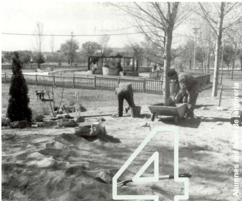
Alumnes del taller de jardineria