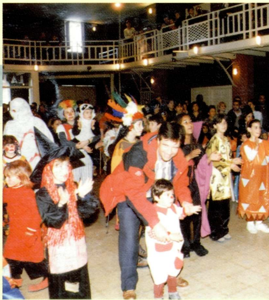
22 de gener de 2000. Processó de Sant Sebastià