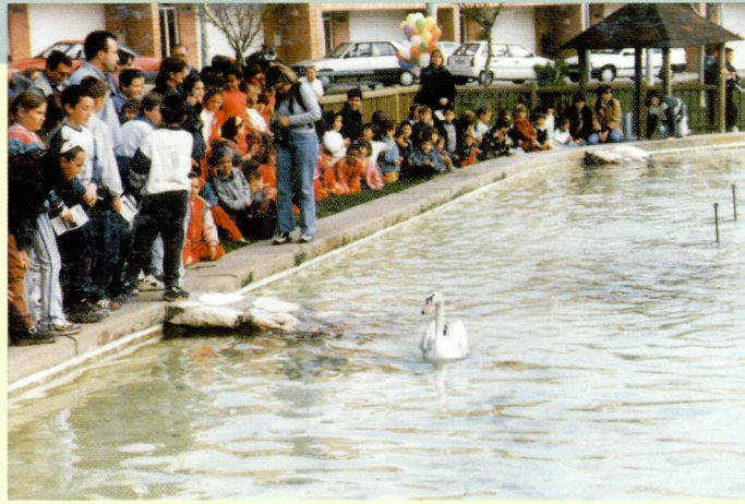
24 de maig de 2000. Festa d'arribada dels anecs al Parc del Graó