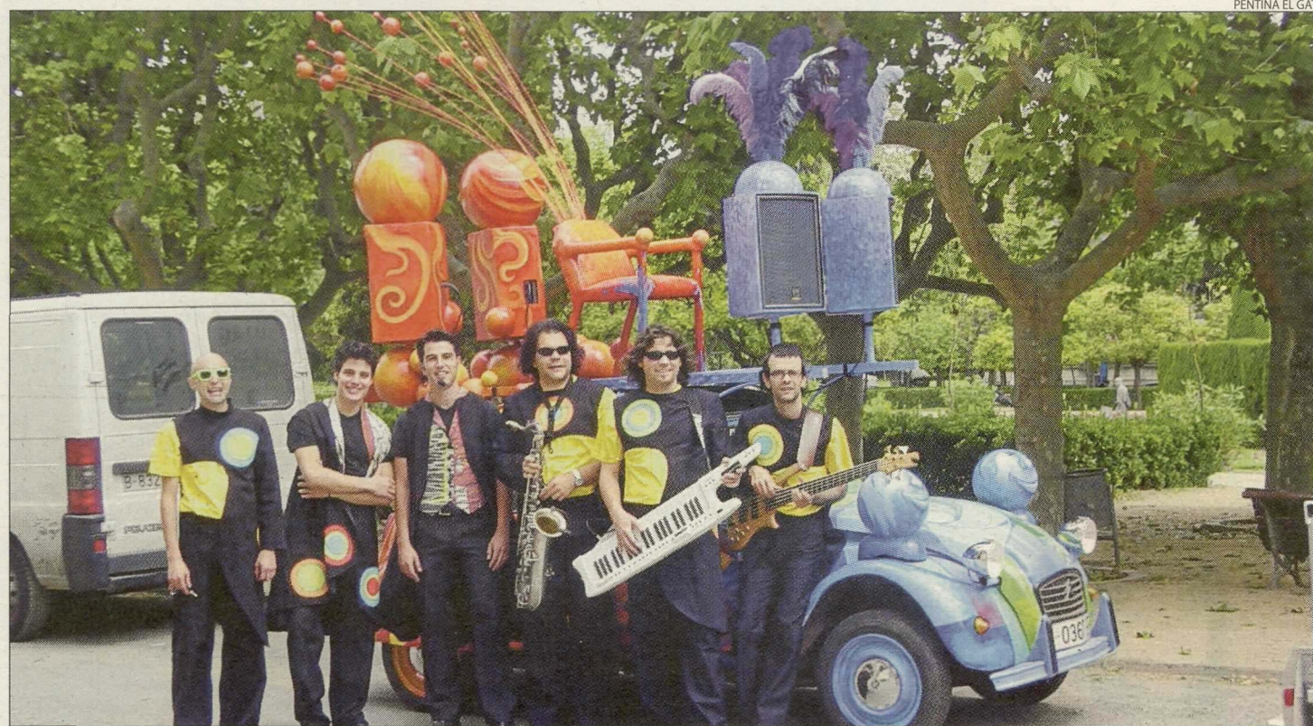
La formació posarà el punt final al bloc d'activitats destinades als més petits.