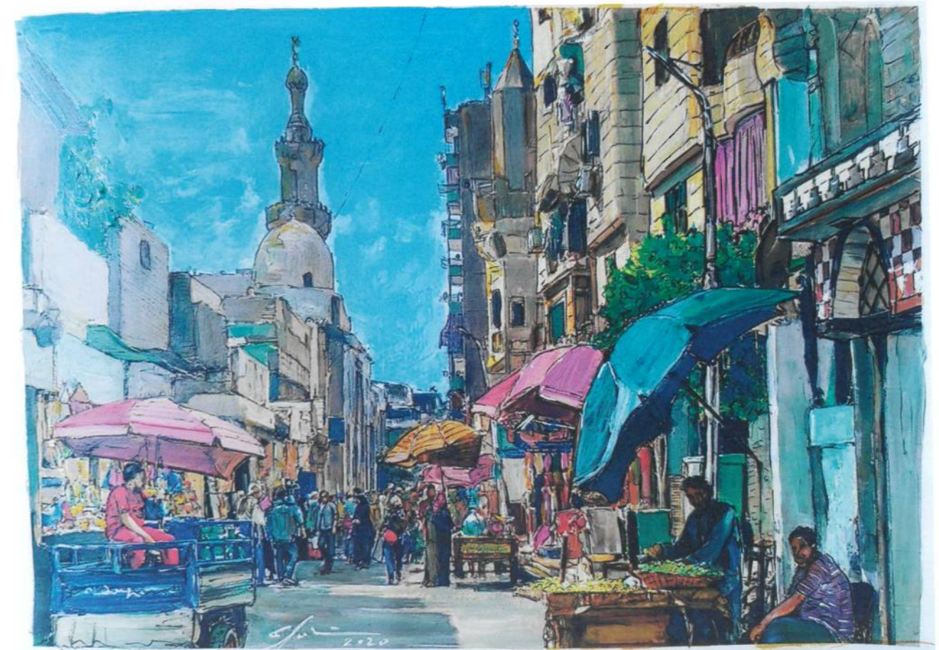
El Caire. Carmina Solà.