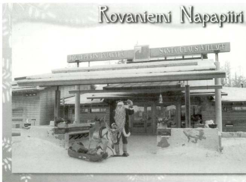
Casa de Santa Claus al Pol Nord

Llavors, entre la tradició pagana, com els déus havien estat bons amb mi, hi havia un regla molt important, la regla de la correspondència. Ells entenien que no es rebia res gratuïtament. D'allò que obtenim n'hem de donar alguna cosa. Entre ells hi havia una norma obligada en funció del