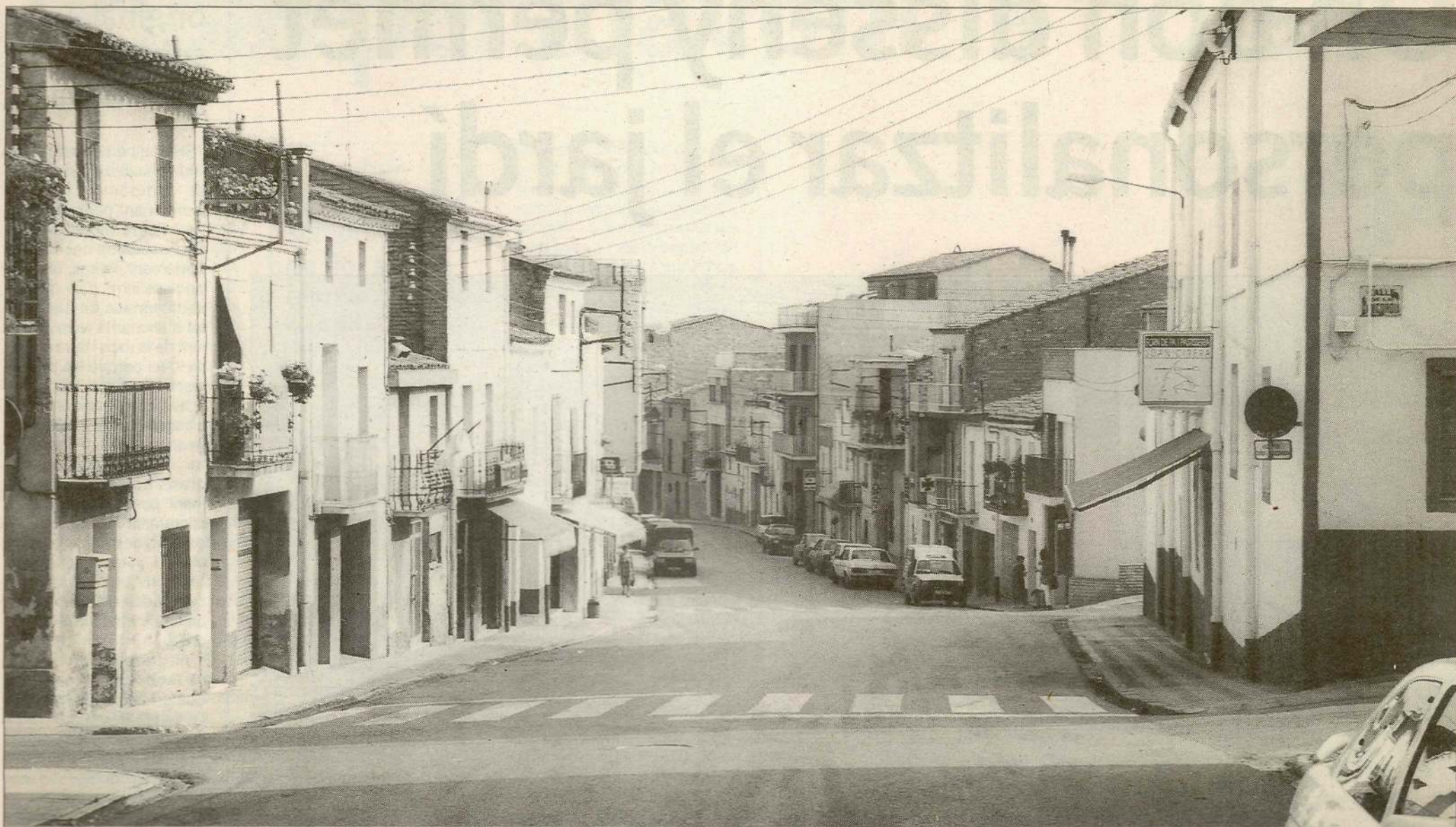
El certamen ha estat organitzat des de la regidoria de Cultura de l'Ajuntament d'Alpicat