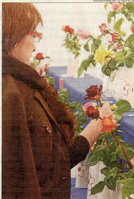
El certamen s'inaugurarà aquesta tarda.

L'agenda inclou tallers per tindre cura de bonsais o crear figures amb material vegetal