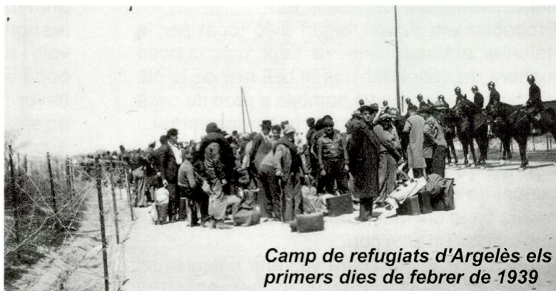
Camp de refugiats d'Argelès els primers dies de febrer de 1939

Nosaltres estàvem a l'est i havíem de fer un bon tros de camí per arribar-hi. Totes les setmanes era jo l'encarregat d'anar a buscar les racions que tocaven al meu pare. Agafava l'autobús a Martorelles, poble situat a uns quilòmetres d'on vivíem, fins al barri de Sant Andreu, a Barcelona. Allà pujava el tramvia, però aquest no em portava fins a Gràcia, on era