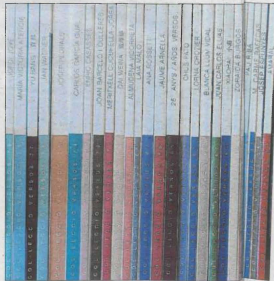
Llibres de la nova etapa de la col·lecció Versos, iniciada l'any 2017.