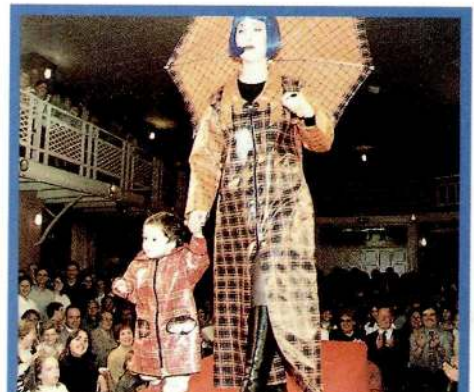
Uns curiosos vestits de pluja.