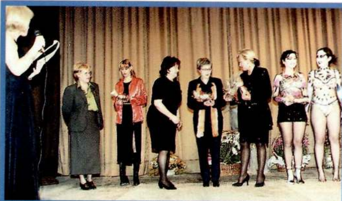
Marthal, Cucurull, Belledone, Máystar i Kentia, firmes al certamen.