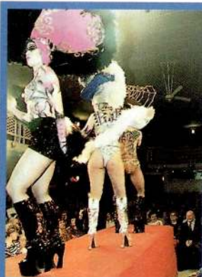
Els vestits de nit i els maquillatges corporals van aixecar molta expectació.