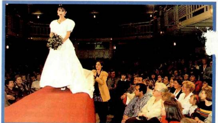
La desfilada va incloure un vestit de núvia.