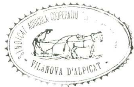
Segell del sindicat, any 1937.

Poc després, al setembre, la Generalitat decretà l'afiliació obligatòria de tothom a un sindicat. Els nous dirigents de La Íntima van aprofitar l'avinentesa per insistir que tot el poble s'afiliés a l'únic sindicat que hi havia. Uns dies després, el sindicat es va adherir a la Unió de Rabassaires perquè, segons ells, era l'únic que defensava els interessos dels pagesos a Catalunya. Per tant, a partir d'aquell moment, el sindicat s'anomenà Sindicat Agrícola Cooperatiu Unió de Rabassaires.