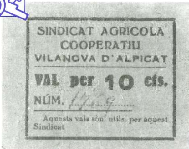
Paper moneda emès pel sindicat l'any 1937