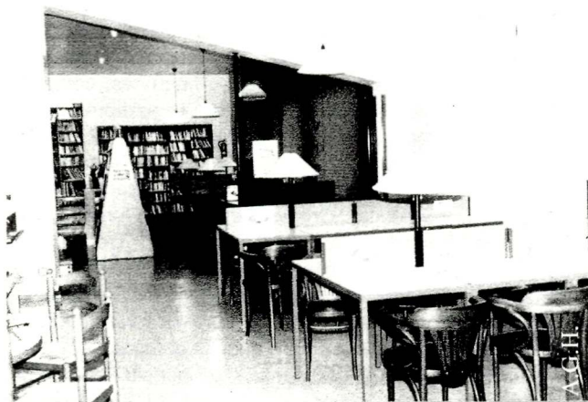
Biblioteca Sant Bartomeu d'Alpicat