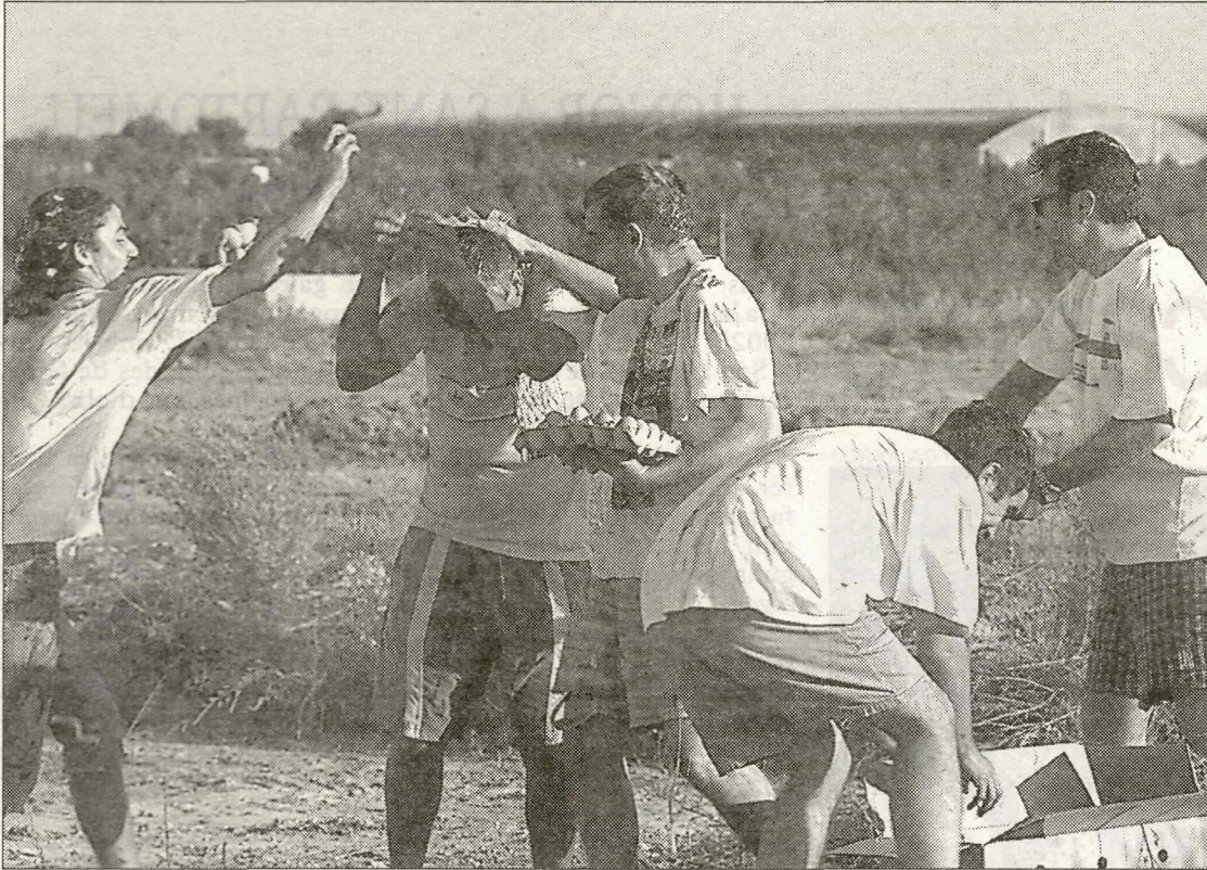
El bon humor i les ganes de gresca caracteritzaran l'enfrontament, que se celebrarà divendres.