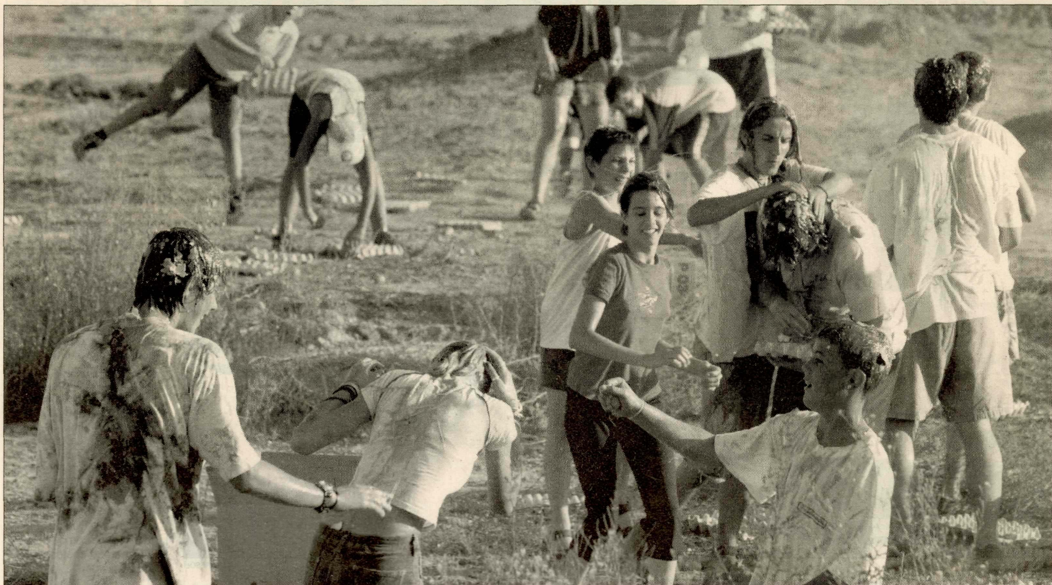
Les festes d'Alpicat estan plenes de gresca i disbauxa