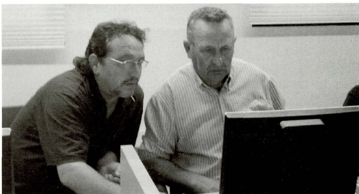
Atents a les explicacions del grup de nit

Des de la posada en funcionament del Centre Telemàtic d'Alpicat el passat dia 27 de febrer, els dinamitzadors del Centre, a banda de la formació que han impartit, han atès i han donat suport a les persones que s'hi han adreçat.