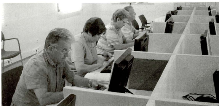
Curs per als jubilats que no volen perdre el tren de les Noves Tecnologies

Ajuntament d'Alpicat Regidoria de Comunicació i Noves Tecnologies