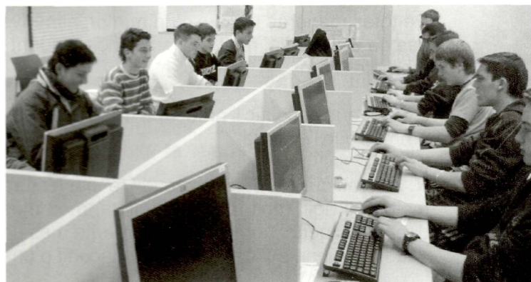
Usuaris del Centre Telemàtic