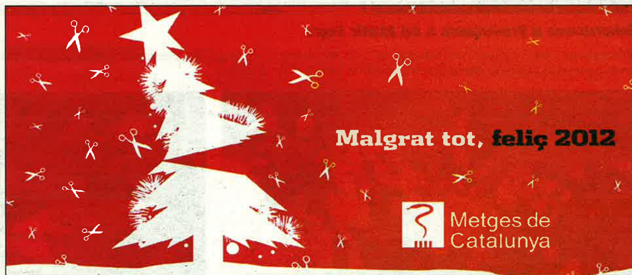
Los recortes en Sanidad no impiden la felicitación navideña de los Metges de Catalunya