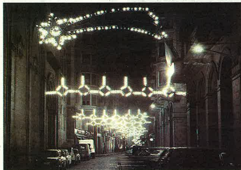
ARXIU HISTÒRIC DE LLEIDA