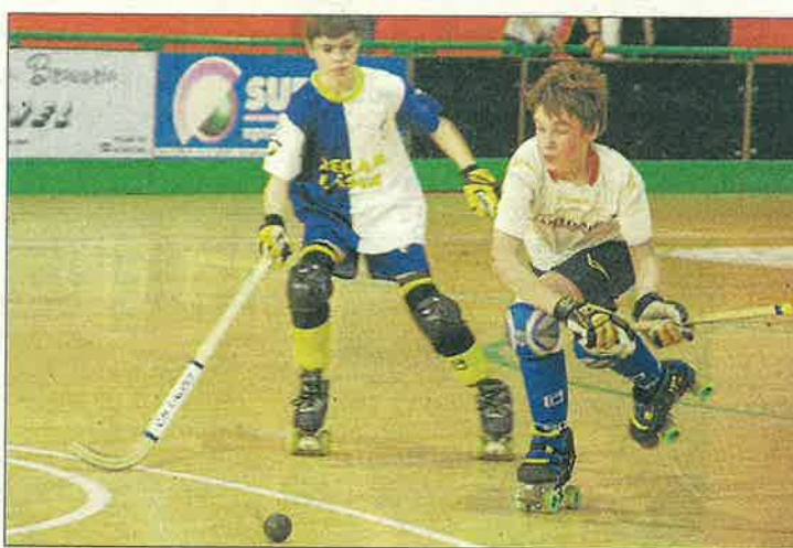
El Teldair va superar de cap a peus el Caldes.

Mollerussa. Gran partit de l'aleví del Mollerussa, que arredoneix una temporada certament brillant. Els del Pla d'Urgell van demostrar el seu gran