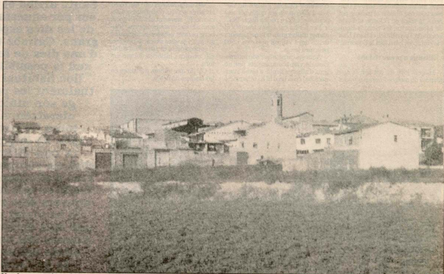
Nombroses entitats de la vila han col·laborat en l'organització dels actes festius.

Alpicat és un municipi del Segrià que comprèn al sud-oriental una perllongació del pla de l'horta de Lleida i al nord-oest continua pels