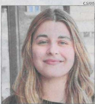
Aina Comes LA SEU D'URGELL

■ "Tinc un 7 de Batxillerat. Esperava més bona nota, però estic contenta. Vull estudiar una carrera relacionada amb la salut i en funció de la mitjana que em quedi decidiré, encara que m'atreu molt Odontologia. Castellà era l'examen que més em preocupava, però veig que no n'hi havia per tant."