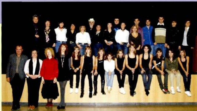
Dimecres de Salut. Del 5 de novembre al 3 de desembre