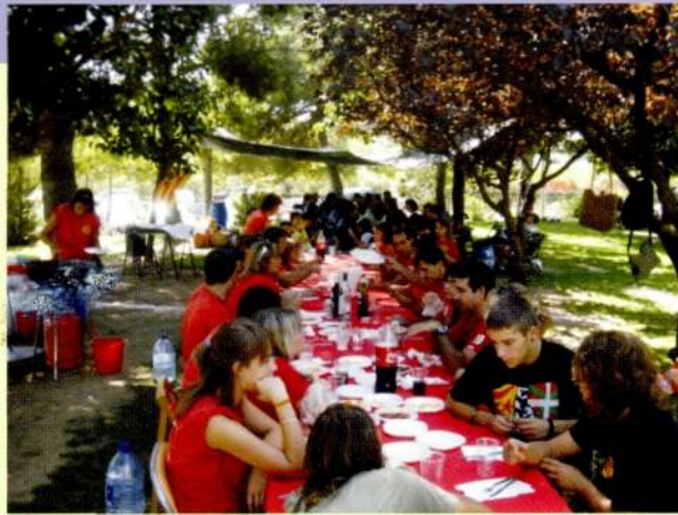
19 i 20 de setembre de 2008. Festa de la Mascota