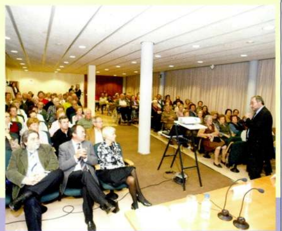
23.11.2008. Acte central de commemoració del Dia Internacional de la no Violència Contra les Dones