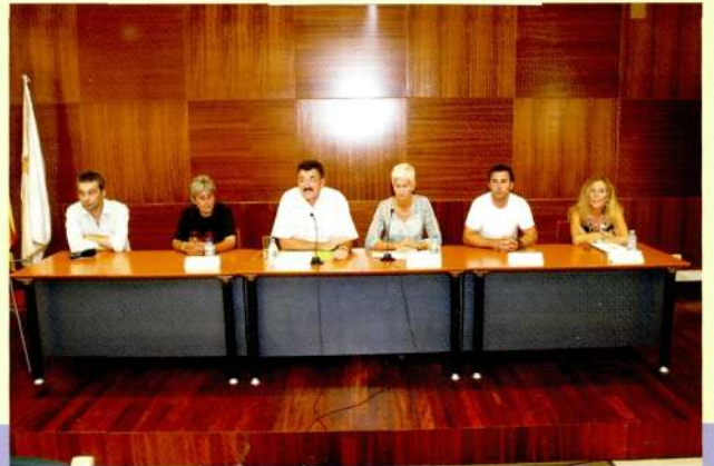
11.9.2008 Diada Nacional de Catalunya i festa de la Catxipanda