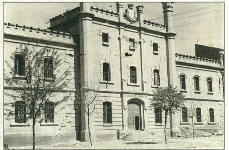
Imatge de l'antiga presó dalt de la rambla d'Aragó.