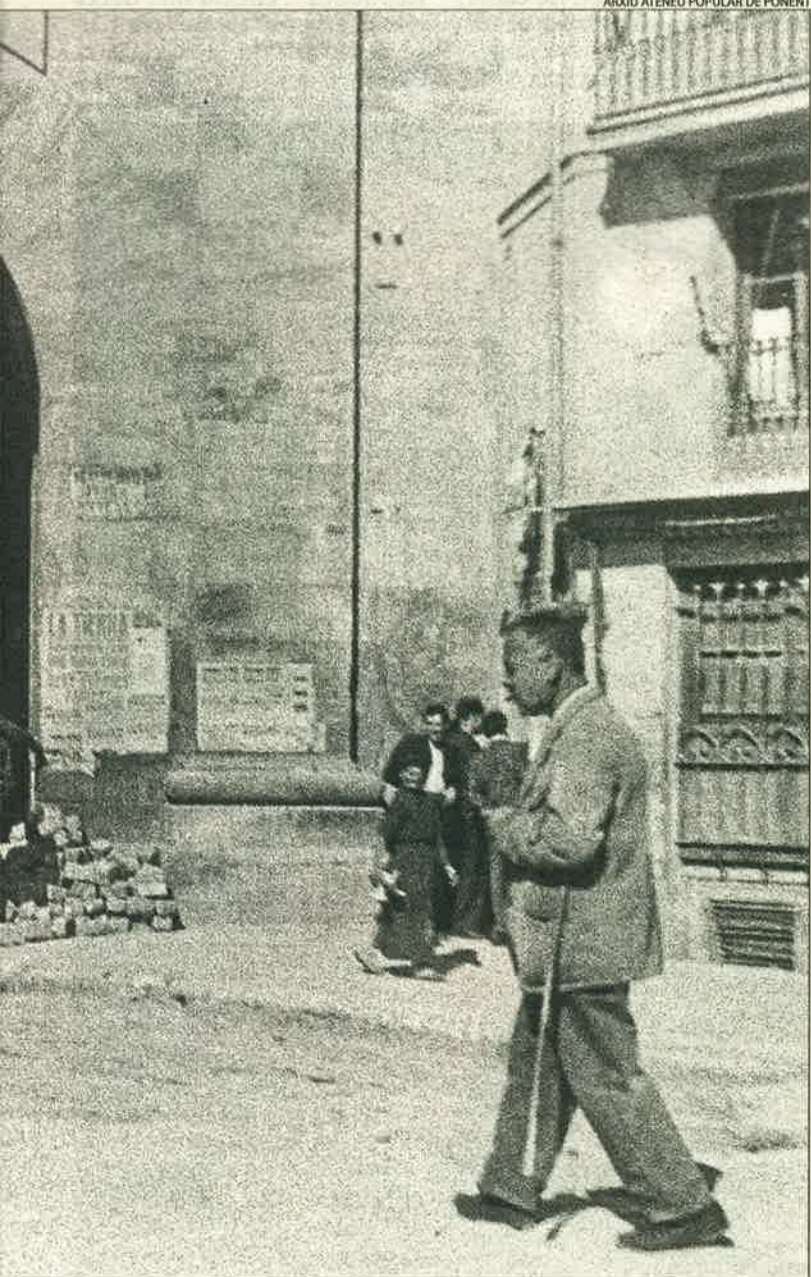
AIXIÚ ATENEU POPULAR DE PONENT

d'esquerres van ser destituïts de forma massiva i van ser substituïts per altres de formats per la minoria de dretes o per gestores. Els sindicats i un gran nombre d'entitats també van ser reprimits.