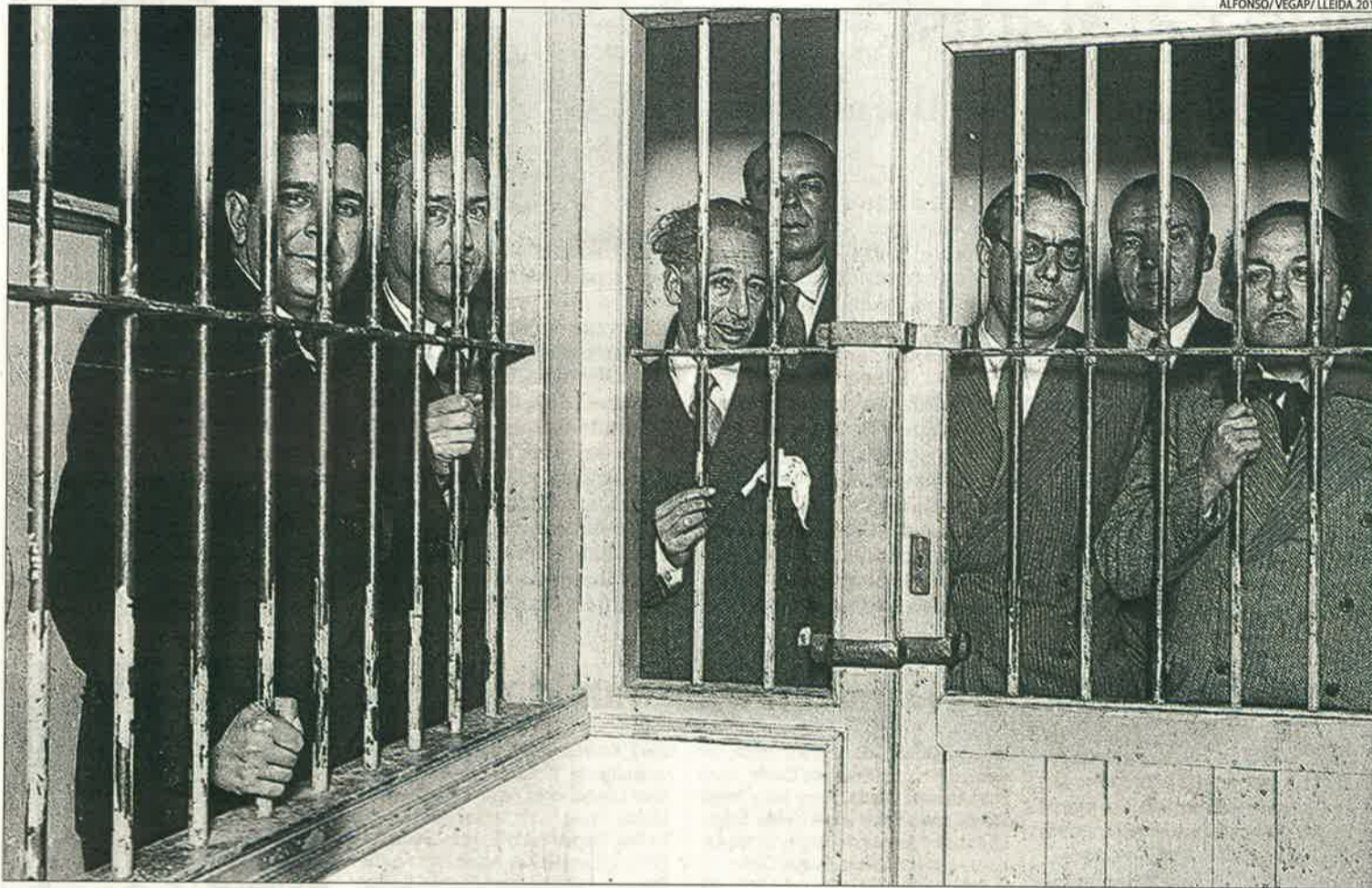
A la presó. Lluís Companys i els consellers de la Generalitat, en una cel·la del Palau de Justícia durant el seu judici després dels Fets d'Octubre.

El conflicte es va aguditzar després que la dreta catalana, a través de la Lliga i l'Institut de Sant Isidre, forçés Madrid a portar al Tribunal de Garanties Constitucionals l'emblemàtica llei de Contractes de Conreu aprovada pel Parlament. El Tribunal la va suspendre al juny,