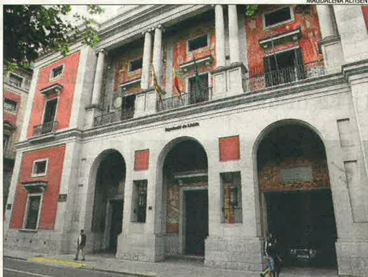
L'actual palau de la Diputació va ser l'escenari dels combats.

proclamar l'Estat Català a la Paeria, però després se'n va anar a casa, igual que la resta d'edils. Així que el gruix de l'acció va quedar en mans de la comissaria delegada de la Generalitat (la delegació del Govern català), amb seu a l'actual palau de la Diputació. El seu titular, Pere Valdeoriola, va permetre que membres de l'Aliança Obrera accedissin a l'edifici i a les armes, segons reflecteix Manel López al seu llibre. Així, la seu de la Generalitat va ser el bastió de resistència davant de l'exèrcit, que des de la Seu va desplegar part de les seues tropes per Ca-