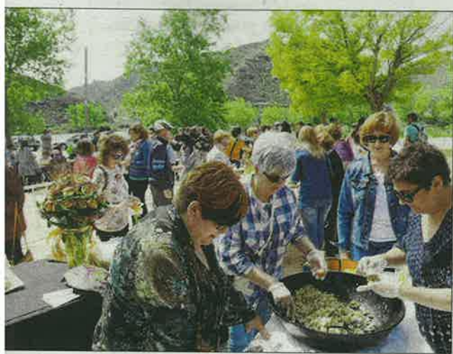
Mequinensa. Els carrers del poble vell de Mequinensa van recuperar ahir la bullícia amb la celebració de Sant Jordi.