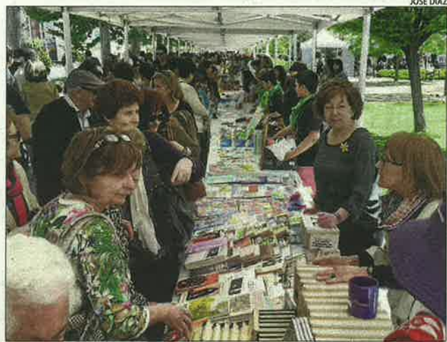
Fraga. La ciutat també va celebrar animadament el Dia de Sant Jordi, patró d'Aragó, amb animació als carrers.