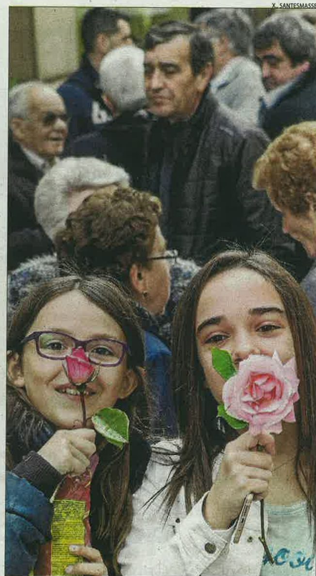
Tàrraga. Dos nenes mostren les seues roses enmig del tumult de gent que ahir va sortir al carrer a la capital de l'Urgell.