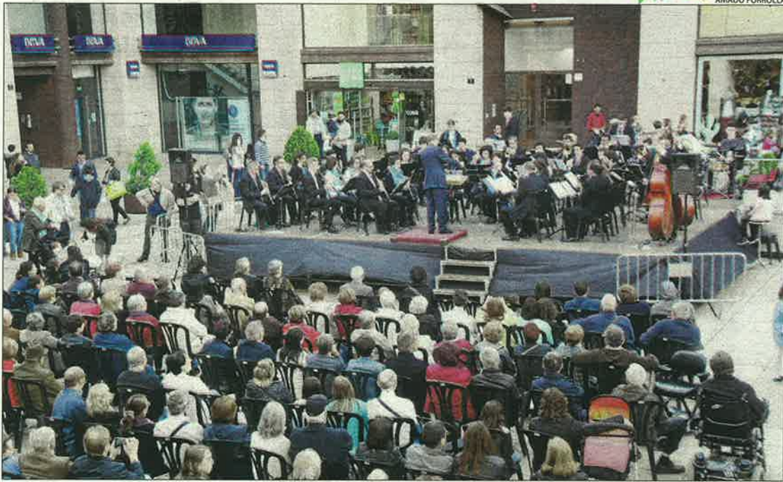
Concert de la Banda Municipal de Lleida, ahir a la tarda a la plaça de Sant Joan.