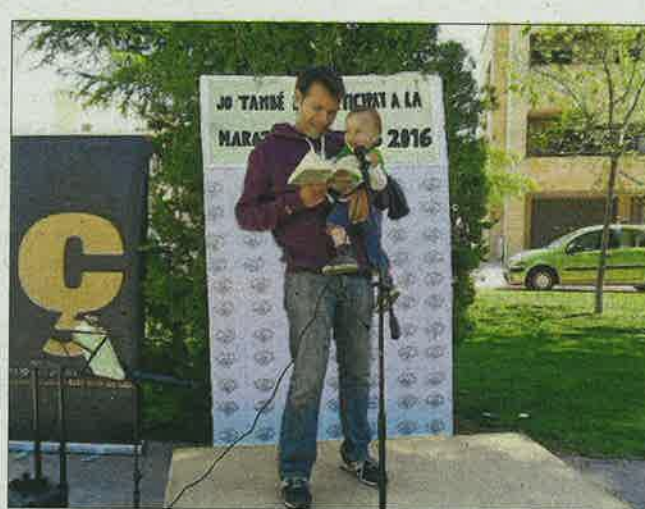
El Palau d'Anglesola. L'acte més original va ser la Marató de lectura de més de 7 hores de Charlie i la fàbrica de xocolata .