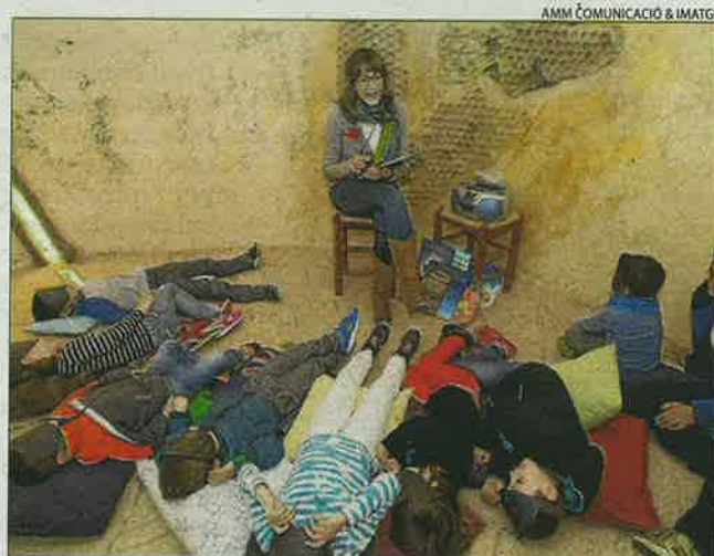
Espai Guinovart d'Agramunt. Al Drac li agrada llegir va ser l'activitat pensada per atreure els petits de la casa.