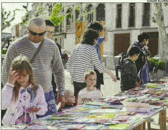
Ivars d'Urgell. Els nens d'Ivars d'Urgell no es van perdre l'oportunitat d'escollir un llibre acompanyats dels seus pares.