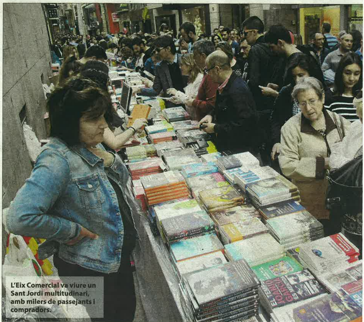
L'Eix Comercial va viure un Sant Jordi multitudinari, amb milers de passejants i compradors.