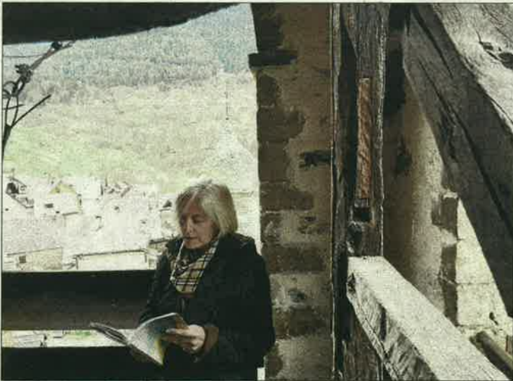
Val d'Aran. A Vilac va tenir lloc una lectura de poemes des de dalt del campanar de l'església, en el marc de Versos des del campanar.