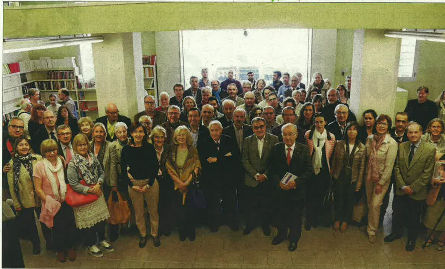
Pagès Editors va convidar al tradicional esmorzar a la seua seu gairebé centenar de persones entre autors, col·laboradors i polítics.