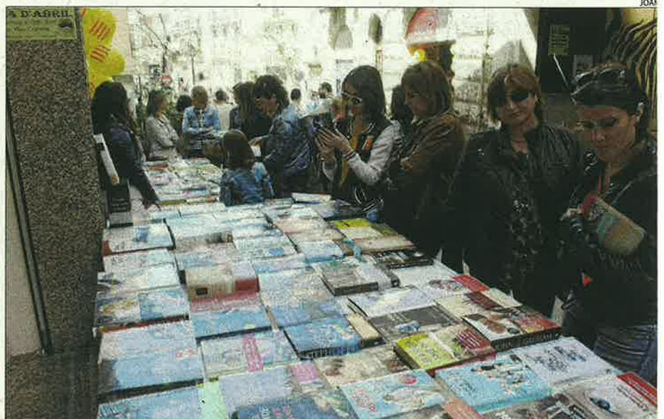
Mollerussa. Les parades amb les últimes novetats literàries van atreure els veïns de la capital Pla d'Urgell al carrer per celebrar la diada de Sant Jordi tal com manen els cànons.