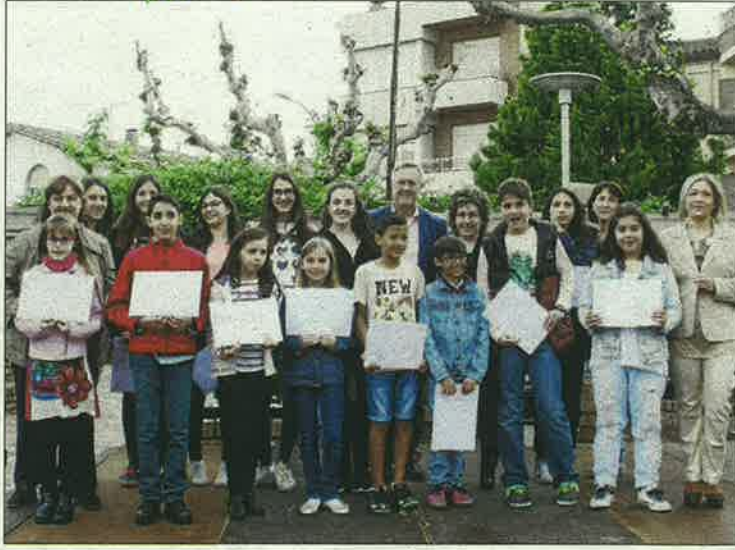
Bellpuig. En el marc dels actes de Sant Jordi, a Bellpuig també es van entregar els premis del Concurs Infantil i Juvenil de Prosa i de Pintura.