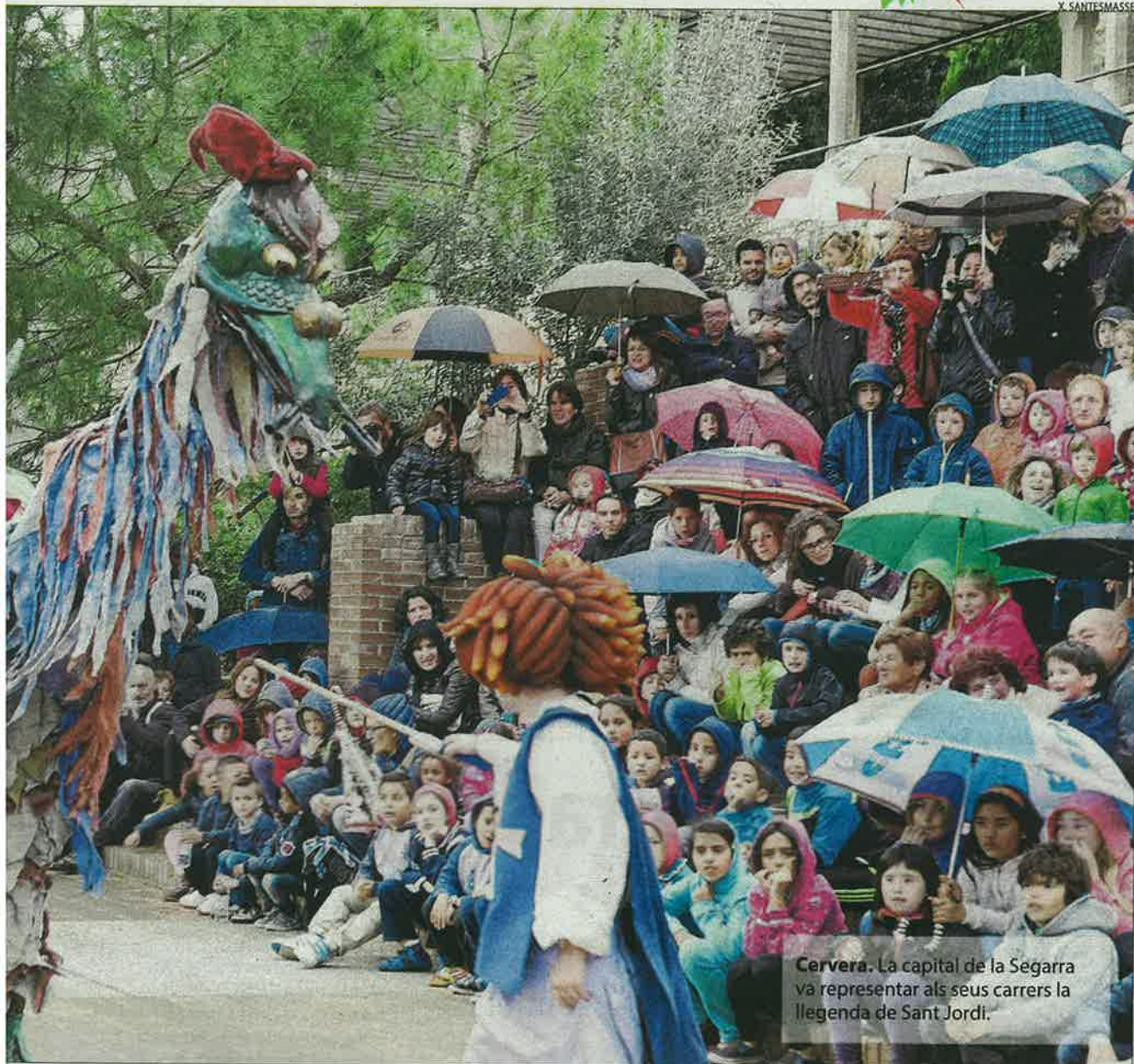
Cervera. La capital de la Segarra va representar als seus carrers la llegenda de Sant Jordi.