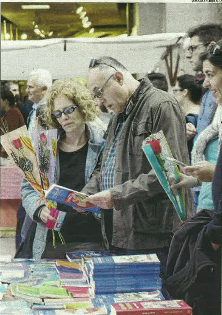
Milers de lleidatans van complir la tradició del llibre i la rosa.