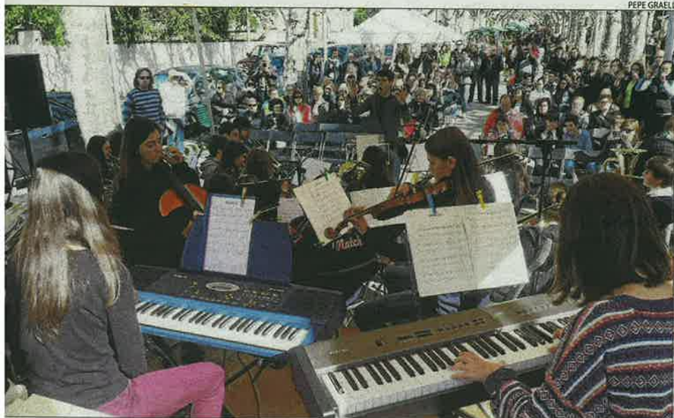
Seu d'Urgell. La música va animar al matí els veïns que es passejaven entre les parades de llibres i roses encara que la pluja va propiciar que a la tarda, el passeig estigués poc freqüentat.