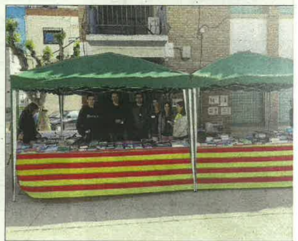
Soses. Les parades de llibres es van succeir en pràcticament tots els municipis de Lleida per disfrutar de la Diada.